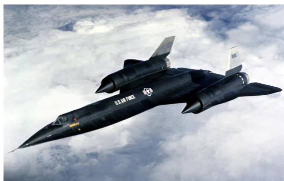
2. ábra SR-71 Blackbird 5

Még 1958-ban az U.S. CIA kezdeményezésére pályázatot hirdettek olyan felderítő repülőgép megtervezésére mellyel helyettesíteni tudnák az U-2-es kémrepülőgépet. A Lockheed cég nyerte el a pályázatban kiírt repülőgép kifejlesztésének és legyártásának jogát. A cég és tervezőcsapata megalkotta az A-12-es repülőgépet, amely első a „Blackbird” szériában. A repülőgép jellemzői közül kiemelkedik, hogy képes 70000 és 80000 láb magasságban tartósan repülni, maximális sebessége eléri a 3.2-es Mach szám értéket. Mindezen mutatók azt a célt szolgálták, hogy elkerülhesse a radarral való felderítést, vagy ha az sikerült is az ellenségnek, az A-12-es megsemmisítésére nem volt esély az akkori technikai színvonalon álló vadászrepülőekkel, vagy légvédelmi rakétákkal. 1964-ben egy továbbfejlesztéssel optimalizálták a meglévő A-12 típust, létrejött a „Blackbird” széria következő repülőgépe a Lockheed SR-71. Az új repülőgép túlszárnyalta a korábbi típust, mivel képes volt a 90000 láb magasságba emelkedni és a 3.3 Mach számnak megfelelő repülési sebességet elérni. Az SR-71-es magába foglalt számos STEALTH technológiai elemet, nevezetesen a döntött függőleges vezérsíkot, a kompozit anyagokat a kulcsfontosságú helyeken és a különleges radar jel elnyelő festést.