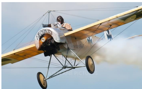
1. ábra Fokker E III replika 2

Az Első Világháborúban a német mérnökök kísérleteztek a Cellulóz-Acetátból 1 készült repülőgép elemekből összeállított katonai gépekkel, mellyel csökkenteni kívánták a gépek láthatóságát. Ilyenek például a Fokker E III vagy az Albatros C I repülőgépek. Az a tény viszont, hogy az ilyen gépek erős napsütésben gyakorlatilag ragyogtak épp a kívánt hatás ellenkezőjét eredményezték.