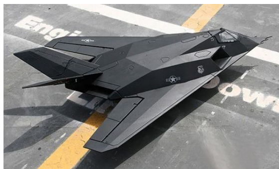
3. ábra F-117 Nighthawk 6

A technológia folyamatos fejlesztése során a mérnökök a különböző méretű és szerkezeti kialakítású repülőgépeken a rádiólokációs felderíthetőség tanulmányozása során megállapították, hogy a legjobban a repülőgépeken a sárkány szerkezet nagy összefüggő sík fémfelületeiről verődnek vissza a jelek, valamint a külső függesztményekről, főként oldal irányba. A tapasztalatok azt mutatták, hogy a visszaverődő rádióhullámok intenzitása nagymértékben csökkenthető, ha a repülőgép sárkányszerkezetét úgy alakítják ki, hogy annak felületei egymással szöget bezáró síklapokból álljanak. Így a rájuk sugárzott radarjeleket szétszórják főleg a világűr felé. A lopakodó gépeken a hagyományos repülőgépekkel ellentétben a függesztmények a sárkányszerkezeten belül helyezkednek el, a hajtóművek szívócsatornáit a törzs felső részén alakítják ki. „A visszatükrözési tulajdonságok tovább gyengülnek, amennyiben a rádióhullámokat átbocsátó áramvonalas borítólemezek alatt a sárkány fém teherviselő elemeinek (pl. bordák) kialakításánál is belső áttükrözést biztosító felületeket képeznek ki.” [8][21][25]