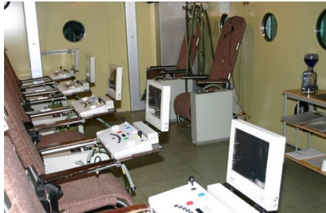
2. ábra Repülőorvostani vizsgálati berendezés 7