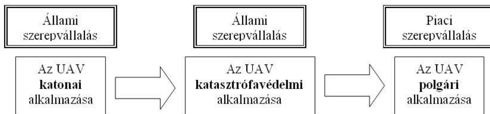
2. ábra. Az UAV-k alkalmazásának transfere korszerű felfogásban.

A katasztrófavédelmi feladatok egy része, de különösen az operatív beavatkozások jellegzetessége, hogy a felszámolást egyenruhás tűzoltók, polgári védelmi szakemberek kezdik meg. A feladatellátás szervezettsége, az uniformitás és a parancsutasításos rendszer nélkülözhetlensége mind azt bizonyítja, hogy a katasztrófavédelmi feladatokat ellátó szervezeteket a téma szempontjából tekinthetjük félkatonai szervezeteknek is. Ezért az UAV katonai alkalmazásának polgári transzferéhez a katasztrófavédelmi alkalmazások ideális lehetőséget nyújtanak.