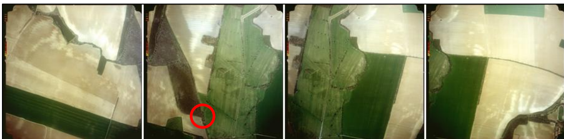
1. ábra Légi felvétel-sorozat a kiemelkedés tágabb környezetének értelmezéséhez (saját szerk.)

A geoarcheológiai kutatások során következtetni próbáltam elsősorban a domb keletkezésének körülményeire, a terület történelmi tájhasználatára, valamint egykor betöltött szerepére. E célból készültek a területet lefedő légifotók, és végeztem el a terület talajtani, morfológiai elemzését, majd vizsgálataimat kiterjesztettem a dombot határoló ártérre is, mivel feltételeztem, hogy az áthalmozódási folyamatok révén, a környezetének eltemetett rétegei további információval szolgálnak majd a főbb kérdések megválaszolását illetően. Az így előállított térbeli/vizuális és kvantitatív adathalmaz elemzése alapján pedig igyekeztem meghatározni a terület felszínfejlődését, segítve és irányozva ezzel a régészek munkáját [7]. A légifelvételek segítséget nyújtottak a kiemelkedés és a környező terület aktuális (2010 őszi) felszínborítottságának és