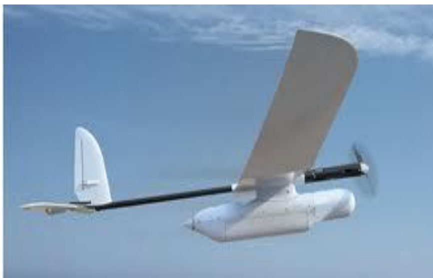
1. ábra Skylark 1-LE

A Magyar Honvédség a huszonegyedik század első évtizedének végére többé kevésbé megfelel a digitális világ kihívásainak. A digitális eszközök használata általánossá vált. A mai kor fegyveres küzdelmeinek jellemzői között megjelentek olyan eszközök, amik információ technológiai ismeretek nélkül nem használható. A precíziós fegyverek, digitális katona, információs hadviselés olyan kulcs kifejezések, amik jellemzik a mai kor fegyveres küzdelmeit. A Honvédség digitális képességei próbálnak lépést tartani az új kor kihívásaival, de az ország gazdasági nehézségei akadályozzák ezt a folyamatot. Üdítő kivétel a rövid hatótávolságú távirányított repülő eszközök területe. A Honvédség által beszerzett rövid hatótávolságú távirányított eszköz a Skylark 1-LE. Ennek az eszköznek a kezelői (operátorok) voltak a vizsgálatom alanyai. A kezelőkkel folytatott interjúk alapján készítettem el az operátorok munka kompetenciáit.