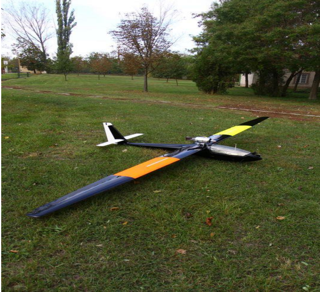
3. ábra METEOR 3MA

A Honvédség, mint már említettem, használ UAV-eket. Felderítési célokra a Skylark 1-LE rövid hatótávolságú távirányított eszközt és a Meteor 3MA célrepülőgépet. Jelen kutatásomban csak a Skylark 1-LE rövid hatótávolságú távirányított eszköz kezelőinek kompetencia vizsgálatát végeztem el.