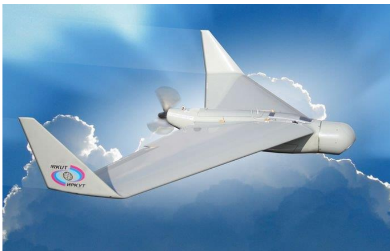
1. ábra RPA Irbkut-10

E tényeknek az összessége elvezethet ahhoz, hogy a földi célok elleni támadásokban eltekintenek az ember által végrehajtott repülésektől. Ezzel együtt a harcászati légierő még viszonylag hosszú időn keresztül támaszkodik majd a repülőgép-vezetőkre, mivel a légi harcban a „lecserélés” lényegesen összetettebb, mint a különböző légi csapásmérő fegyverek eljuttatása a földi célponthoz.