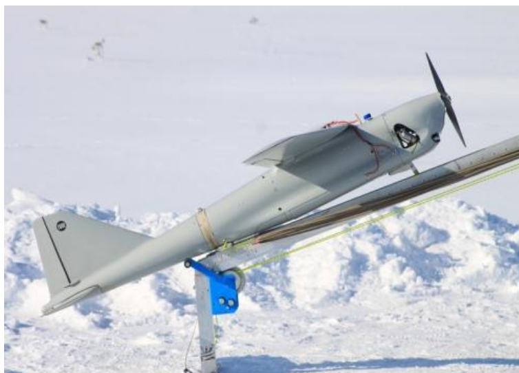
12. ábra RPA „ Orlan-10 ”

A rendszer lehetővé teszi nehezen elérhető terepen lévő jelentős méretű tárgyak ellenőrzését. Alkalmazása kutató-mentő munkálatokban is lehetséges. Kedvezőtlen időjárási körülmények a konstrukció megbízhatóságának köszönhetően sem jelentenek akadályt az eszköz számára. A fejlesztés során a moduláris felépítésnek köszönhetően a szerkezetet úgy alakították ki, hogy a fedélzeti eszközöket rendkívül operatívan lehet megváltoztatni és variálni és a gépet szétszerelt állapotban lehet szállítani. Az RPA-t felszerelték fényképezőgéppel és girosztabilizátoros televíziós kamerával is. A földi irányító állomás egyszerre 4 távirányítású repülőgépet képes vezérelni. Bármelyik közülük lehet akár átjátszóállomás azoknak az RPA-nak a számára, melyek nagyobb távolságra vannak a földi központtól. A felszállás katapulttal, míg a leszállás ejtőernyő segítségével történik.