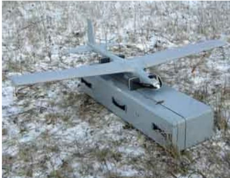
24. ábra „Istra-10” RPA

Segítségével elvégezhető a kijelölt terület megfigyelése, földi célok kutatása, felderítése és azonosítása, mozgó és stacioner célok célkövetése. Fontos feladata még a célok koordinátáinak valós idejű eljuttatása a felhasználóhoz, a vizsgált terület fotótérképének elkészítése.