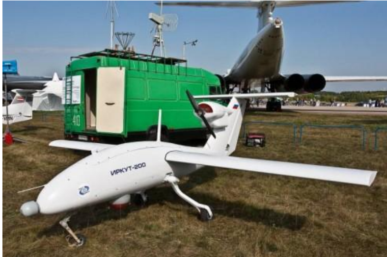
32. ábra az „Irkut-200” RPA

Rendeltetése a vizsgált területről készült fényképek, televíziós és hőkamerás felvételek, rádiólokátoros felderítési adatok valós idejű továbbítása, a kapott felderítési adatok komplex feldolgozása és értékelése, valamint az operátor által kijelölt célobjektumok koordinátáinak meghatározása. Ezen kívül alkalmas kisebb méretű terhek szállítására is.