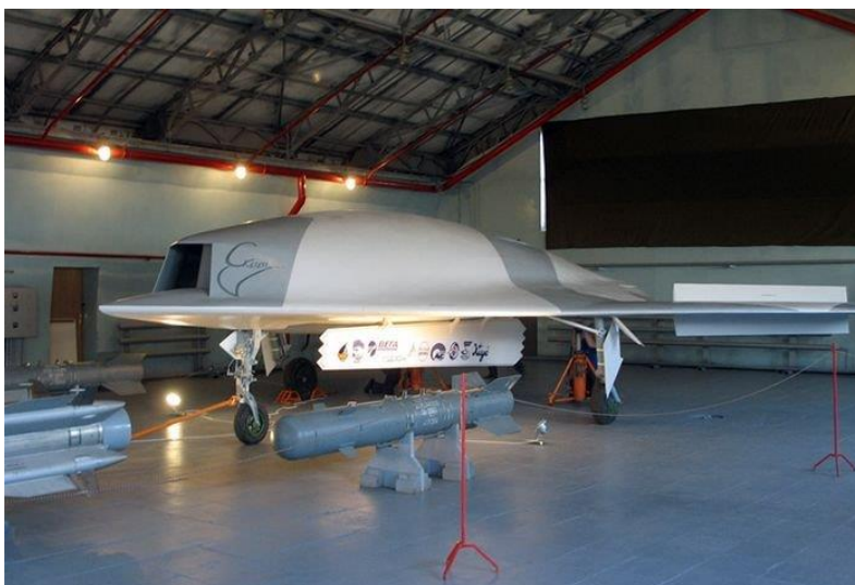
3. ábra RPA Szkat

szerint ez az új eszköz, melyet a „Szuhoj” iroda tervez, egyidejűleg a 6. generációs vadászpilóta típusal szemben meghatározott követelményeknek is meg fog felelni. Feltételezhető, hogy a kísérletek aktív fázisa 2016 előtt nem kezdődik el, míg a tervezett rendszeresítés időpontja 2020-ra tehető. Feltételezhető, hogy a repülőeszköz konstrukciója alapján a modul felépítésű lesz, amely a katonai felhasználók számára lehetővé teszi, a hasznos terhelés a kapott feladat függvényében történő variálását.