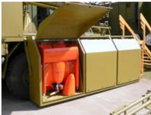
4. ábra RPA TIPCSAK a szállító konténerben

A Tipcsak RPA rendeltetése felderítő és adó-vevő berendezés szállítás annak érdekében, hogy felderítési adatokat gyűjtsön és azokat valós időben továbbítsa vizuális adatok formájában a földi irányító állomásra meghatározott útvonalon, programozott és rádióirányítással végrehajtott repülési üzemmódokban. A magas technológiai szint lehetővé teszi azt, hogy a szétszerelt állapotban szállított eszközt a bevetés előtt alig 15 perc alatt startra kész helyzetbe előkészítsék. A többször felhasználható távirányított repülőeszköz meghajtását dugattyús motor biztosítja.