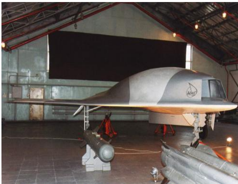
18. ábra Szkat harci drón

felhasználásával készült. Ez jelentősen csökkenti a rádiólokátoros felderíthetőséget. A repülőgép irányítását a szárny kilépő élén található kitérithető kormányfelületek biztosítják. Ezek segítségével lehetséges a hossz és kereszt tengelye körüli elfordulása és az útirány tartása, valamint az aerodinamikai fékezés. A „Szkat” RD-5000B típusú sugárhajtóművel rendelkezik, melynek tolóereje 5040 kp. Az orrészben helyezkedik el a hajtómű üzemeléséhez szükséges levegő beömlőnyílás. A futómű tradicionális 3 pontos, főfutó és orrfutó elrendezésű behúzható rendszerű. A törzsben 2 darab, 4,4 méter hosszú rekesz található, melyben összesen 2 tonna tömegben levegő-föld rakéta vagy 250-500 kg-os irányított bomba rögzíthető.