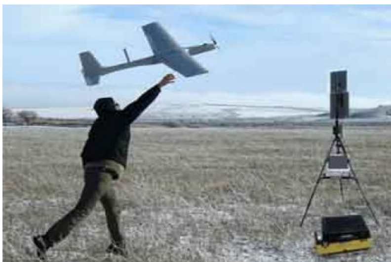
25. ábra az „Istra-10” RPA indítása

A repülőeszköz hasznos terhelése lehet: videó és infrakamera, fényképezőgép. A felszállás kézi indítással, míg a leszállás repülőgépszerűen történik.