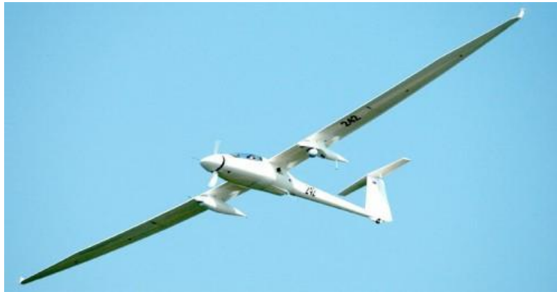
26. ábra „Irkut-850” RPA

Az „Irkut-850” RPA rendszer felderítésre és kisebb méretű terhek szállítására alkalmas. A gép. Alapvető rendeltetése: valós idejű képi, rádiólokátoros, televíziós, hőkamerás adatok továbbítása és 3D-s térképkészítés, a kapott adatok komplex elemzése és feldolgozása, valamint az operátor által kijelölt földi objektumok koordinátáinak meghatározása.