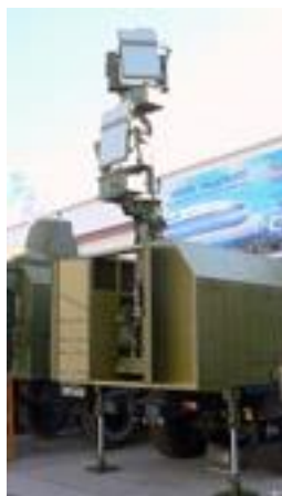
6. ábra antennagépkocsi

információk vétele. A gépjárműben helyezkednek el az RPA-k irányításához szükséges berendezések és egy 12 méter hosszú árbocantenna, amely biztosítja az alacsonyan repülő repülőgépek megbízható irányítását és az információ cserét. Az adócsatorna deciméteres, míg a vevő egység centiméteres hullámhossz tartományban sugároz. Az adó-vevő egység az azimutnak megfelelően körben forog és -10 és +45 fokos függőleges tartományban mozog. A repülőeszköz helyének meghatározására és a domborzat topográfiai felderítésére GLONASS 15 /NAVSTAR műholdas navigációs rendszert alkalmaznak. Az eszköz elektromos táplálását háromfázisú 380/22V (50 Hz) váltóáramú áramforrás vagy a beépített dízel generátorok biztosítják.