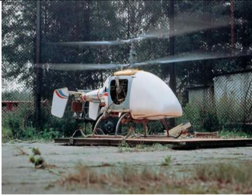
9. ábra Ka-37

A törzsfelfüggesztési pontokon többféle eszköz rögzíthető: