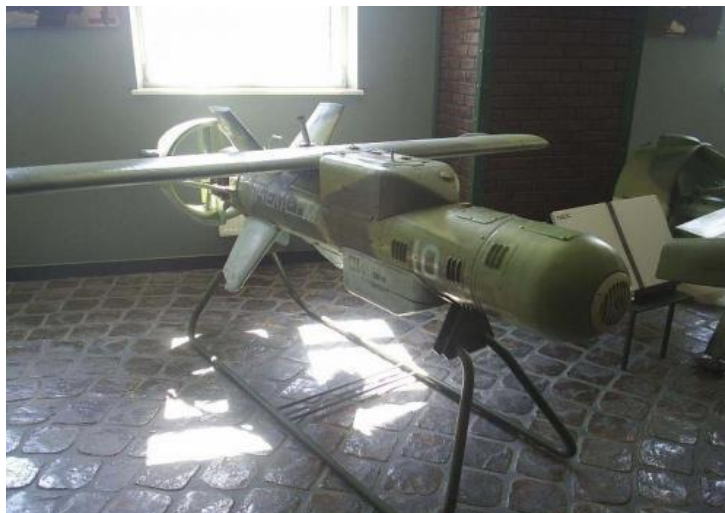
23. ábra Pcsela-1M RPA

csának és az SZKP Központi Bizottságának rendelete alapján, amely távirányítású repülő eszközök fejlesztését irányozta elő. 1982 előtt a tervező iroda saját kezdeményezésére alakította ki az első generációs „Pcsela-1M BPLA-t. Ennek az eszköznek a leszállását ejtőernyő és a törzs alsó részére szerelt felfújható tömlő biztosította, amely a szükséges energia elnyelést segítette.