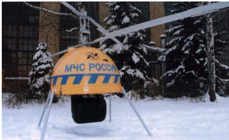
10. ábra Ka-137

A Ka-137 konstrukciója rendelkezik minden olyan, a tartó és transzmissziós szerkezetekre jellemző elemekkel, amelyek a pilóta által vezetett koaxiális elrendezésű helikopterekre is jellemzőek. Az alsó és felső forgószárnyak kétlapátosak. A forgószárnyak torziós rögzítéssel kapcsolódnak az agyhoz és polimer kompozit anyagokból készülnek. A törzs gömb alakú. A farok szerkezet hiányzik a gépről, ami lehetővé teszi, hogy bármely irányba széles sebességtartományban tudjon repülni korlátozások nélkül. Ez különösen fontos lehet turbulens időjárási viszonyok közepette, amikor jelentős és gyorsan változó irányú szélesebbesség tapasztalható. A hasznos teher elhelyezésére szolgáló rekesz a törzs alsó részén a rádióhullám áteresztő áramvonalazó fedél alatt található. Négy, lemezes rugós szerkezetű támasszal rendelkezik.