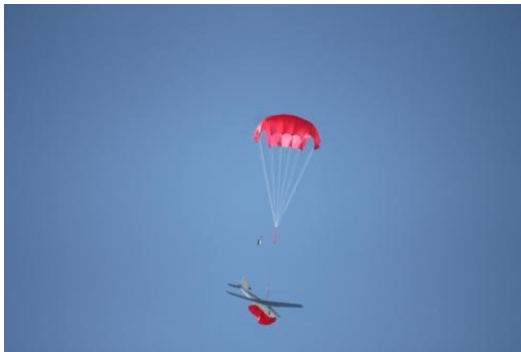
13. ábra RPA „Orlan-10” leszállás