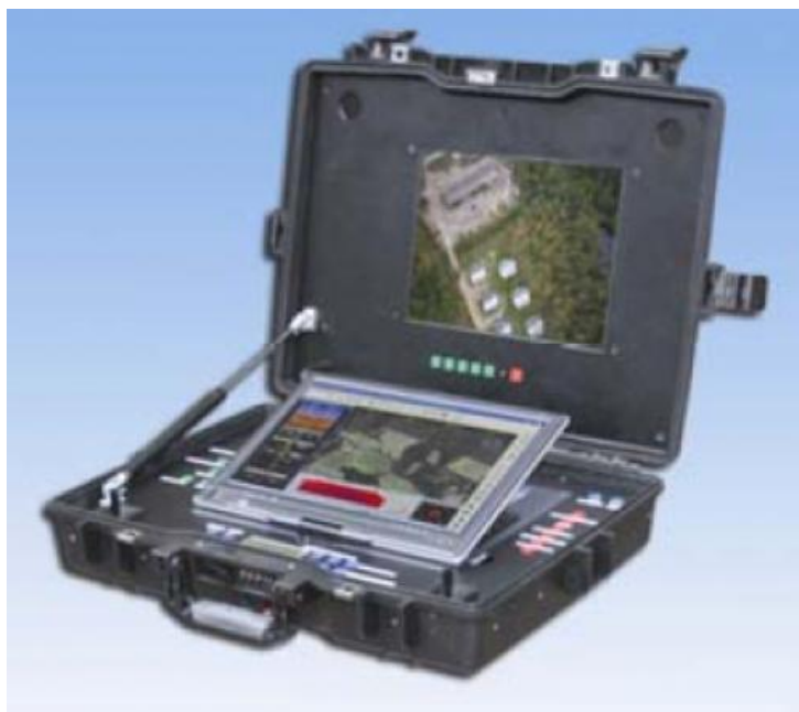
29. ábra az „Irkut-10” RPA földi irányító állomása