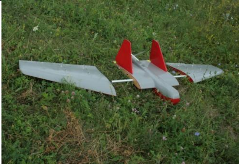
17. ábra T-3 RPA szétszerelt helyzetben

A T-3 RPA STA3x irányító rendszerrel rendelkezik. Ennek a rendszernek az alkalmazásával teljesen automata üzemmódban tud repülni az operátor beavatkozása nélkül.