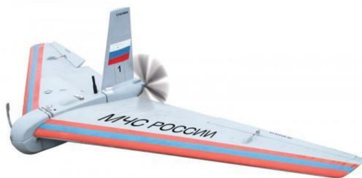
30. ábra az „Irkut-2M” RPA