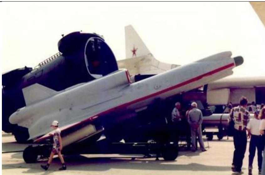
8. ábra RPA „Korshun”