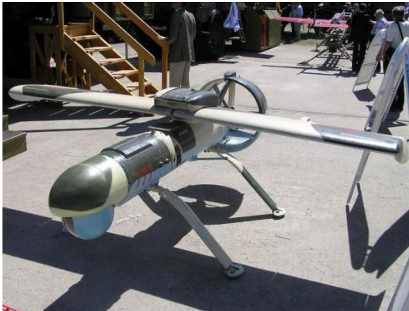
22. ábra Pcsela-1T RPA

A továbbfejlesztett „Pcsela-1T” mérnöki munkája 1982 óta zajlott a Szovjetunió Minisztertaná-