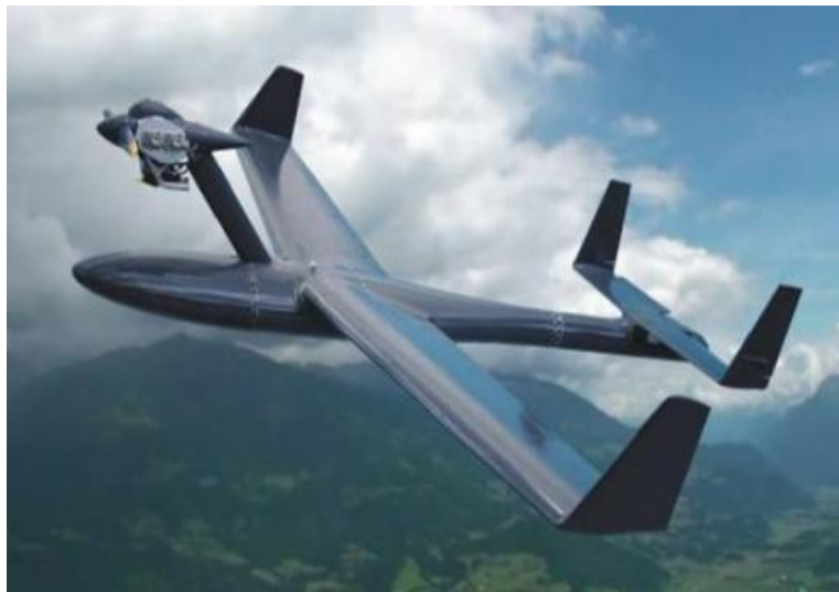
11. ábra RPA „Istra”

Az „ISTRA” RPA rendszer 2 vagy 4 azonos pilótánélküli repülőgépből áll, melyek rendeltetése a légi felderítés és megfigyelés. Ebből fakadó feladatai: