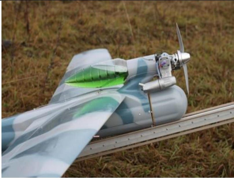
14. ábra RPA „Orlan-3M”

Az eszköz irányítása a földi irányító állomásról történik, amely három variációban rendelhető (hordozható, mobil és stacioner). Egy ilyen állomás 4 repülőgép egyidejű irányítását végzi. A gépek átjátszó állomásként is működhetnek.