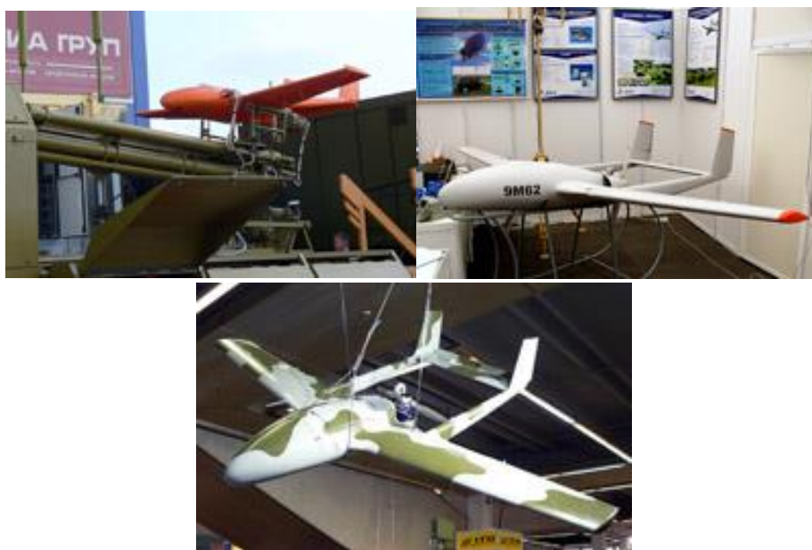
5. ábra RPA TIPCSAK

Az antennagépkocsi szerepe az irányítási parancsok továbbítása egyidőben 2 RPA számára, rádiólokátoros eljárással azok helyzetének meghatározása, telemetriás navigációs és vizuális