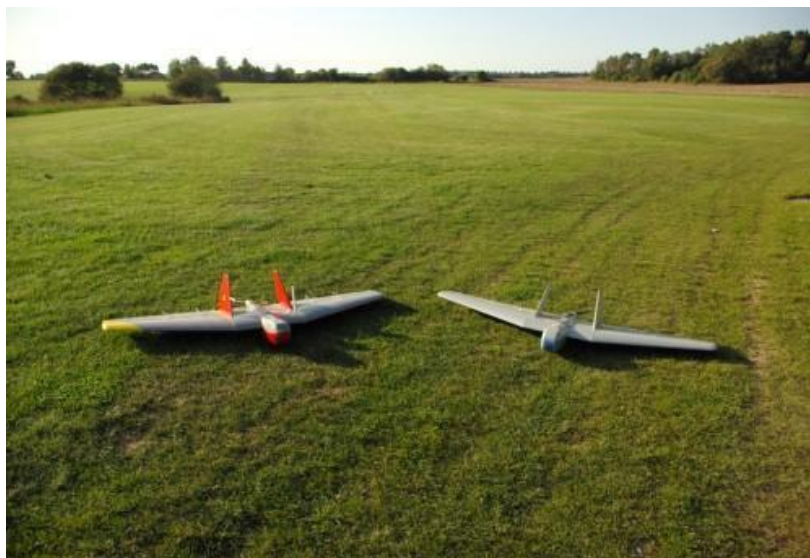
16. ábra T-3 RPA

A „RISSA” tudományos műszaki központ 24 által fejlesztett eszköz rendeltetése: nappali és éjszakai videó megfigyelés, légi fényképezés, és rádióátjátszó állomásként való alkalmazás. Ez a távirányítású repülőgép olyan követelmények alapján készült, amely jelentősen egyszerűbbé teszi az eszköz üzemeltetését, és hogy azt kevésbé kvalifikált személyzet is irányítani tudja. A repülőgép szerkezeti felépítése lehetővé teszi azt, hogy rövid idő alatt lehetséges a célszerűtlen hasznos terhelés megváltoztatását. Ezzel lehetőség nyílik például az éjszakai vagy nappali felvételekhez szükséges kamerák gyors átcserélésére. A „T-3” repülőgépen a felszerelt kamerák két szabadságfokban képesek mozogni. Jelenleg zajlanak azok a fejlesztések, melyek eredményeképpen a légijármű 3 szabadságfokú rögzítési ponttal lesz felszerelve.