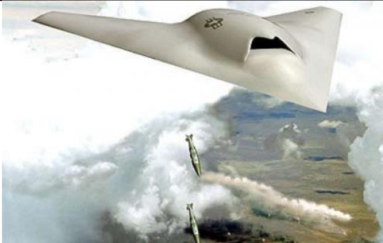
19. ábra Boeing X-45