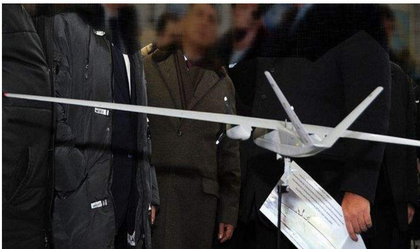
2. ábra RPA Altius

magas technológiai színvonalú kisméretű és kis hatótávolságú pilótanélküli eszközt állít elő, amelyek feladataikat kis magasságban képesek végrehajtani. Ezeket az eszközöket használják az orosz rendvédelmi erők, a Rendkívüli Helyzetek Minisztériuma 4 , különféle polgári szervezetek és még külföldi megrendelők igényeit is kielégítik. Már korántsem ennyire jó a helyzet a nagy magasságban nagy hatótávolsággal rendelkező eszközök tekintetében. Ezen a területen az USA és Izrael vezető helye megkérdőjelezhetetlen. Még az EU országok is az amerikai és izraeli eszközöket vásárolják, annak ellenére, hogy folyik a saját eszközeik fejlesztése is. Oroszország másik jelentős problémája az, hogy amennyiben nincs saját fejlesztési és gyártási kapacitása, akkor ezeknek az eszközöknek a beszerzése az európai országoktól eltérően nem lehetséges. Ennek a helyzetnek két alapvető oka van. Először, valóban modern és korszerű eszközt az oroszok számára senki nem ad el – mivel úgy alakult, hogy a lehetséges eladók számára az Orosz Föderáció potenciális ellenségnek számít. Viszonylag modern RPA-kat még Izraeltől sem tudtak beszerezni (egyrészt azért, mert ezt Izrael sem akarta, annak érdekében, hogy megőrizze a ma létező technológiai fölényt a fegyverpiacon a potenciális konkurencsággal szemben, és ebben az Egyesült Államok nyomása is szerepet játszott).