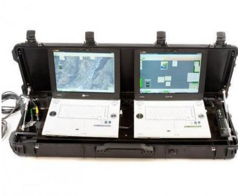
15. ábra RPA „Orlan-3M” hordozható földi irányító állomása

Az eszköz irányítása a földi irányító állomásról történik, amely három variációban rendelhető (hordozható, mobil és stacioner). Egy ilyen állomás 4 repülőgép egyidejű irányítását végzi. A gépek átjátszó állomásként is működhetnek.