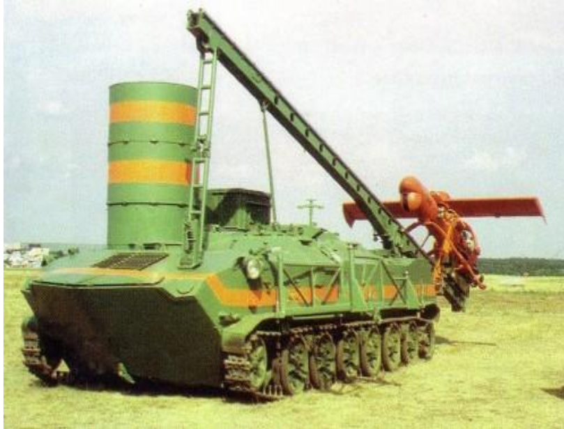
21. ábra Sztraj-P komplexum és a Pcsela-1T RPA

A „Pcsela-1T” harcászati DPLA 26 (távirányítású repülő eszköz) fejlesztése a Kulon Tudományos Kutató Intézet műszaki követelményei szerint a Jakovlev A. S. tervező irodában 27 zajlott.