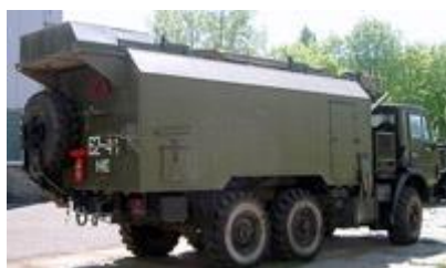
7. ábra az Irányító gépjármű

Az irányító gépjármű rendeltetése a rendszer irányítása és biztosítja a képi és telemetrikus információ vételét feldolgozását és kijelzését, a szükséges korrekció elvégzését, a digitális térképen történő ábrázolását, a felderítendő objektumok és koordinátáinak meghatározása és együttműködés az információkat felhasználó és a műveletet irányító szervezetekkel.