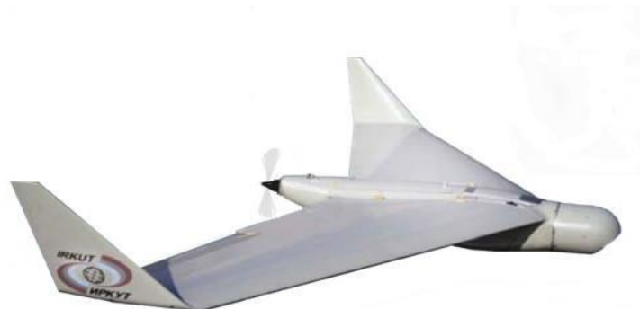
28. ábra az „Irkut-10” RPA

Az orosz ügyészségen belül működő nyomozó ügyészség 100 ezer dollár értékben szerezte be ezt az eszközt. Jelenleg is zajlik a kijelölt ügyészségi állomány felkészítése az „Irkut-10” pilótanélküli repülőgép üzemeltetésére.