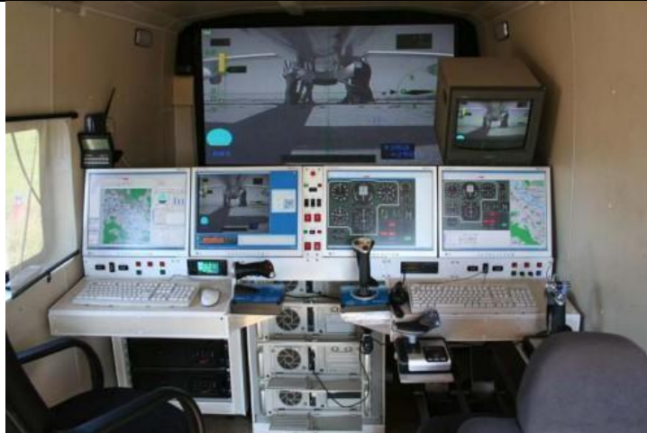
27. ábra az „Irkut-850” RPA földi irányító állomása