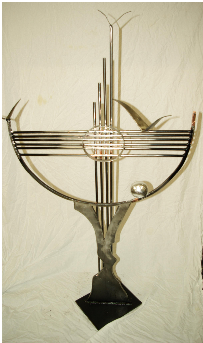
Attila Forsman: Citera, fém