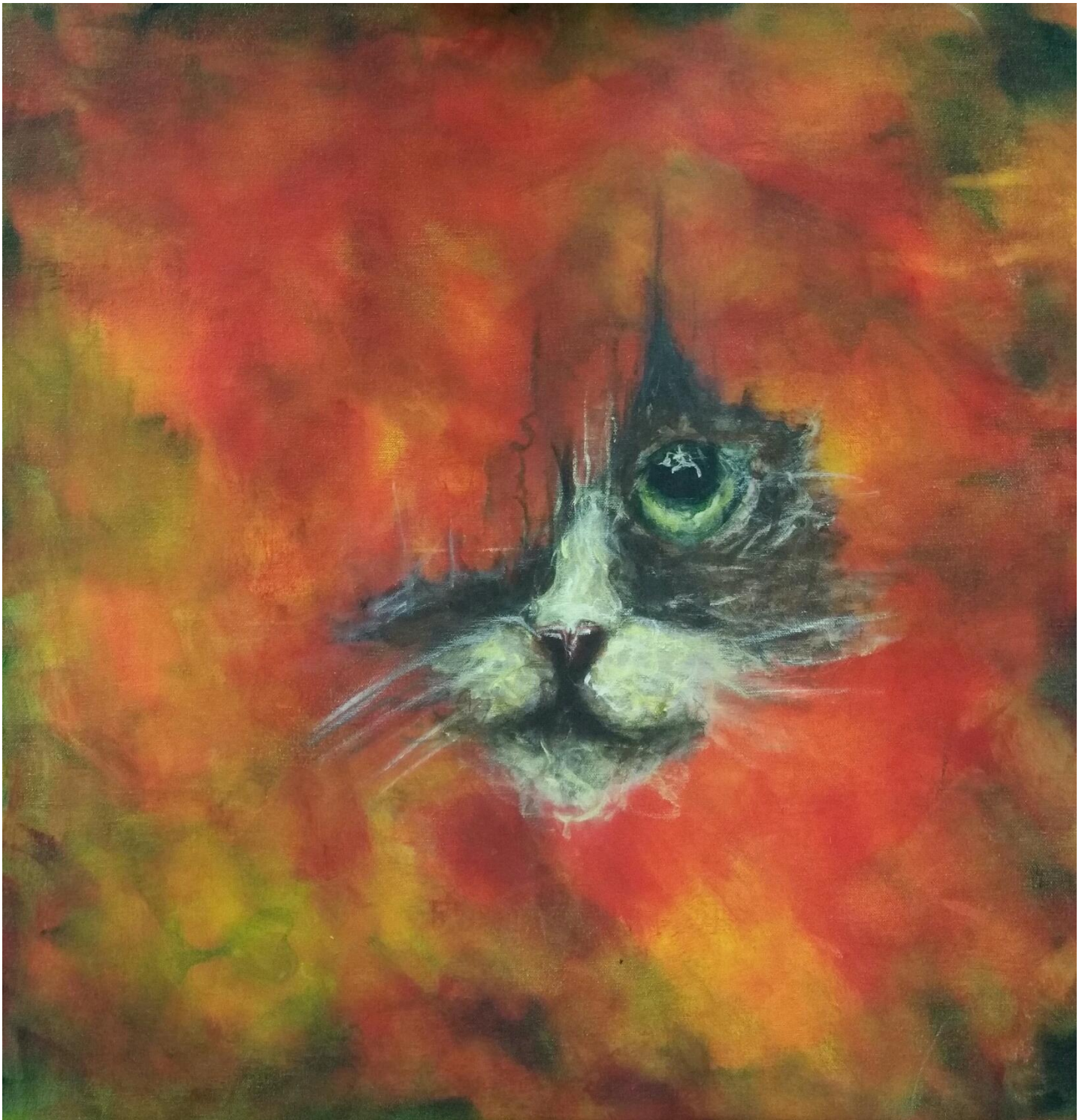
Desiree Forsman: Pillantás, akryl