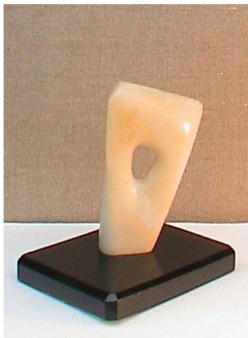
Drab Károly munkája

További munkái a Képtár mellékletben láthatók