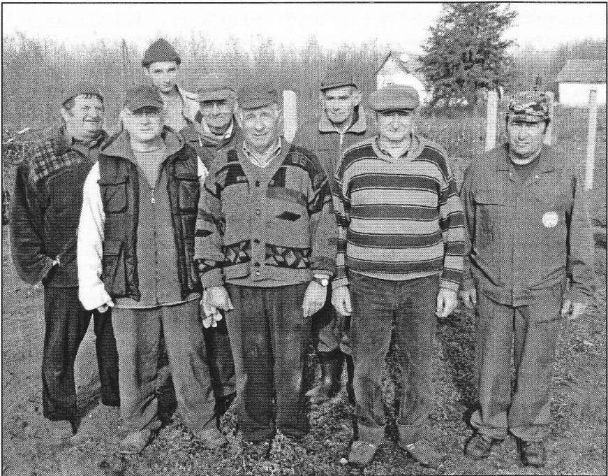
Az önkéntes munkások egy része

Ez év novemberében a temető hátsó része került sorra. Először a kerítésnél vadon nőtt akácfaakat kellett legallyazni, és ahol lehetett, a tuskóknál lefűrészelni. A munkákat nehezítette, hogy kb. 30 éves időszak alatt a drótháló sok helyen belenőtt a vadon nőtt akácfaiba.