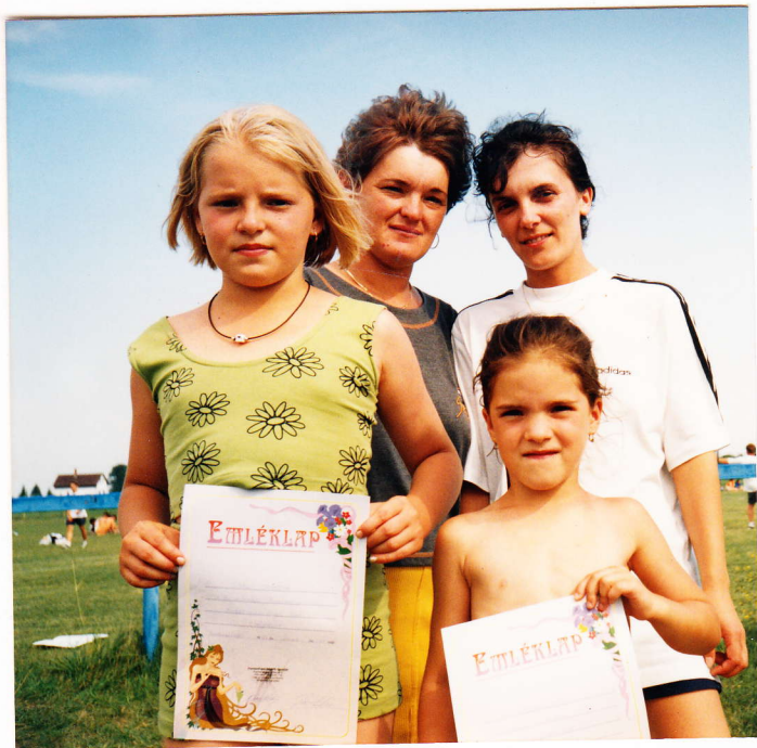
Az első helyezett rajzolók anyukáikkal

első helyet. Csáki Martin legfiatalabb versenyzőként különdíjas lett.