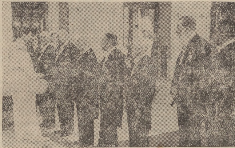
Őfelsége II. KÁROLY király a tartományi főnökök között.

A hivatalos lap egyik legutóbbi számában rendelet törvény jelent meg a bírósági szervezetről, melyben több jelentős újítás van. Így az új rendszer megszünteti a legfelsőbb bírói tanácsot, amely eddig az igazságügyminiszter véleményező szerve volt az előléptetésekre nézve. Ezután a kinevezés a minisztériumi vizsga alapján fog történni, pontosan abban a sorrendben, amilyen osztályzatot a bírót kapott. Az előléptetések szempontjából előléptetési táblát készítenek, részletes indokolással, mi teszi a bírót alkalmassá az előléptetésre, — más befolyás nem érvényesülhet. Érdekes intézkedés az is, amely szerint az igazságügyminiszter előzetes felfüggesztési jog illeti meg, ha a vizsgálóbiztos jelentéséből azt állapíthatja meg, hogy valamely bíró politikai tevékenységben vett részt.