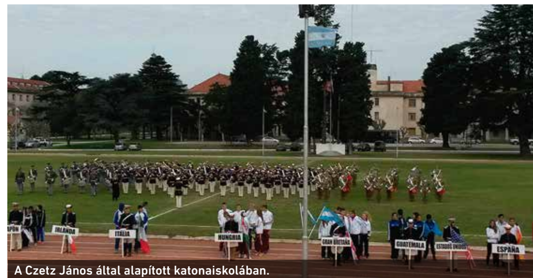
A Czetz János által alapított katonaiskolában.