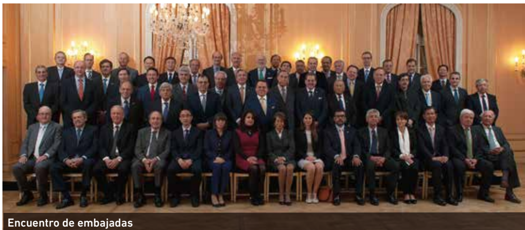
Encuentro de embajadas

EL resultado hasta ahora ha sido positivo, ya que la relación comercial hacia Latinoamérica se ha incrementó en un 25 % entre el periodo de enero a julio de este año y donde hay que