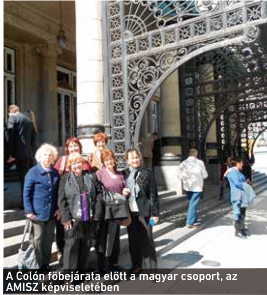
A Colón főbejárata előtt a magyar csoport, az AMISZ képviselőiben

oka? Nem tudjuk. Annyit tudunk, hogy a FAC a nemzeti kormány, a COLON pedig a fővárosi kormány pártfogoltja. Tudjuk azt is, hogy nem szeretik egymást. Én azt gondolom, hogy a FAC megsértődött és tüntetően nem vett részt ezen a kulturális népünnepen.