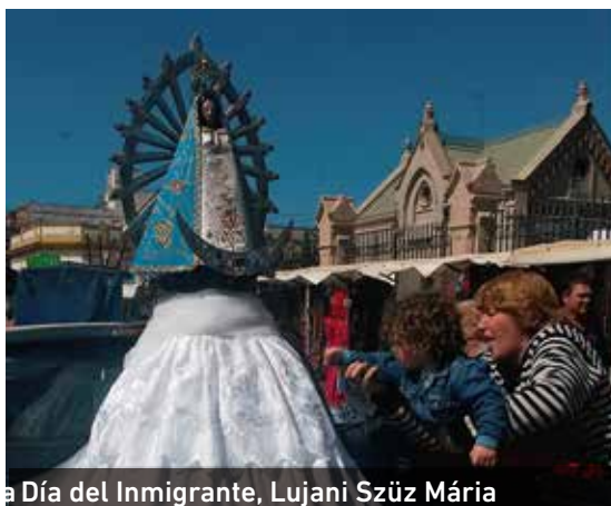
a Día del Inmigrante, Lujani Szűz Mária

A mise egy körmenettel kezdődött, melynek élén a szobrot vitték, és az országok képviselőiben megjelent népviseletben öltözött kis küldöttség követte imádkozás közben. A szertartás a bazilikában folytatódott tovább. Minden nemzetnek megvan a maga kis oltára. Idén új szent kép került a magyar oltárhoz, amely sajnos – több másikkal együtt – jelenleg átépítés alatt van, így csak az átmeneti helyét láthattuk, de biztos vagyok abban, hogy a kép csodálatos helyre fog kerülni.