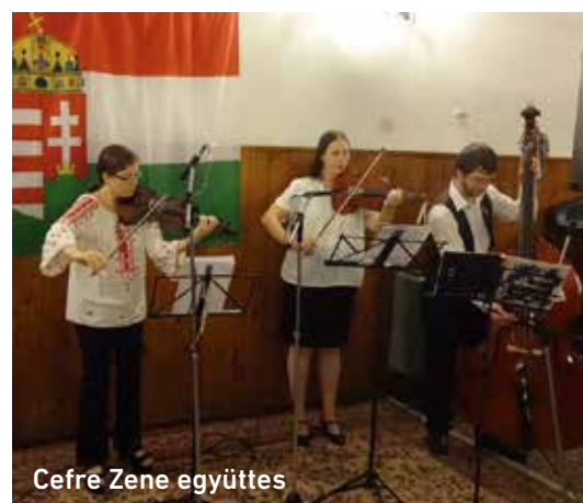
Cefre Zene együttes