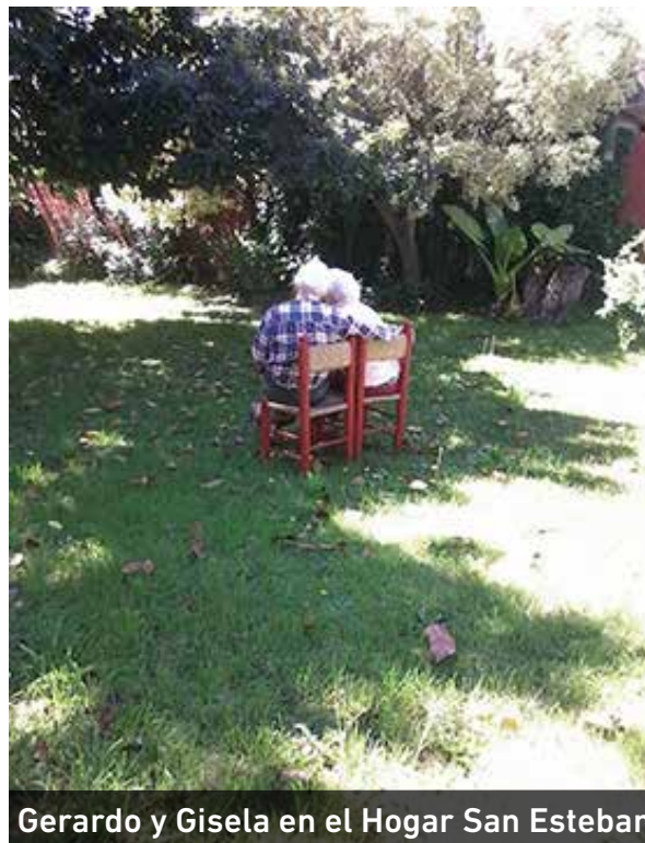
Gerardo y Gisela en el Hogar San Esteban

Se los ve juntos, ella salta de alegría cuando lo ve, se cuelga de su cuello y lo abraza profundamente, se besan, parecen dos enamorados, en realidad siempre ha perdurado el amor en ellos. Gisela tiene 80 años.