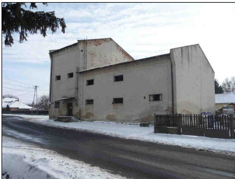
A Cukorgyár fennmaradt legnagyobb épülete napjainkban (Az önkormányzat keresi a pályázati lehetőséget a hasznosításra.)

A cukorgyár épületeiből ma is megtalálhatunk néhányat: a Dának felé vezető út elején, a jobb oldalt álló nagyméretű épületet a rendszerváltozásig magtárként használta a termelősövetkezet, majd magánkézbe került, míg végül az önkormányzat tulajdona lett, baloldalon a volt Volán telephely melletti kolónia és az egykori Alkotmány Tsz volt irodája is a cukorgyárhoz tartozott.