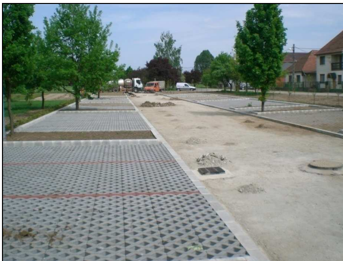
Az épülő parkoló a Művelődési Központ mögött

A 70 személygépkocsi és 8 autóbusz parkolására alkalmas infrastruktúrához egy 320 fő fogadására alkalmas, a kastélyhoz méltó, az átlagosnál magasabb színvonalú és kulturáltságú egyedi megoldású WC-blokk is csatlakozik.