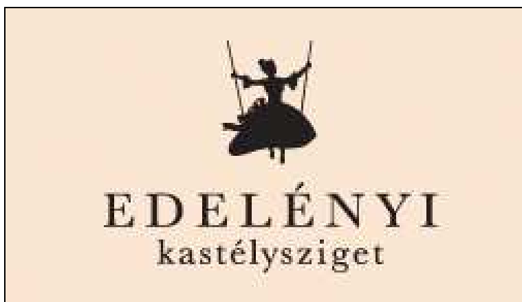
A kastélysziget logója

A kastély a rekonstrukció révén az országos figyelem középpontjába került. Az egyébként turisztikailag jelentős potenciállal rendelkező, de mérsékelt kapacitás-kihasználtságú térség felé fordította a média, a szakma, és a társadalom érdeklődését. Ez a helyzet jó alkalmat teremt arra, hogy a múzeumpedagógiai szolgáltatások sokrétűségével ez a figyelem a jövőben is megmaradjon, ezzel is hozzájárulva az ország egyik leghátrányosabb kistérségének pozitív megítéléséhez.