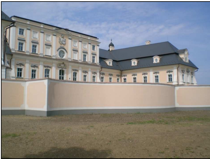
A kastély délről, az újjáépített kerítő fallal