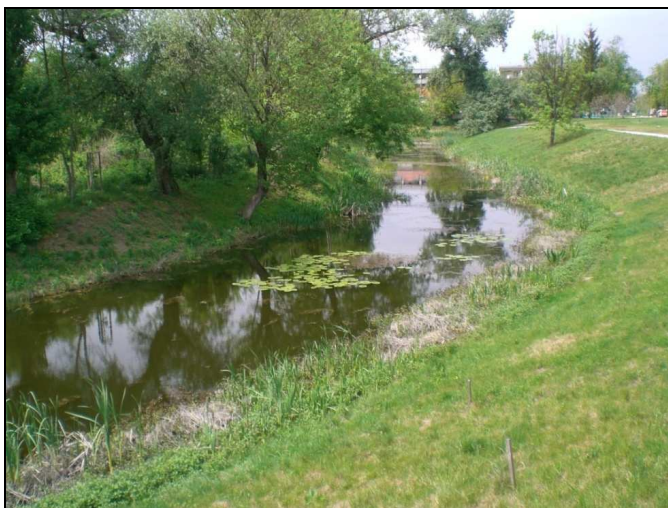
A Bódva holtág egy szakasza a revitalizáció után