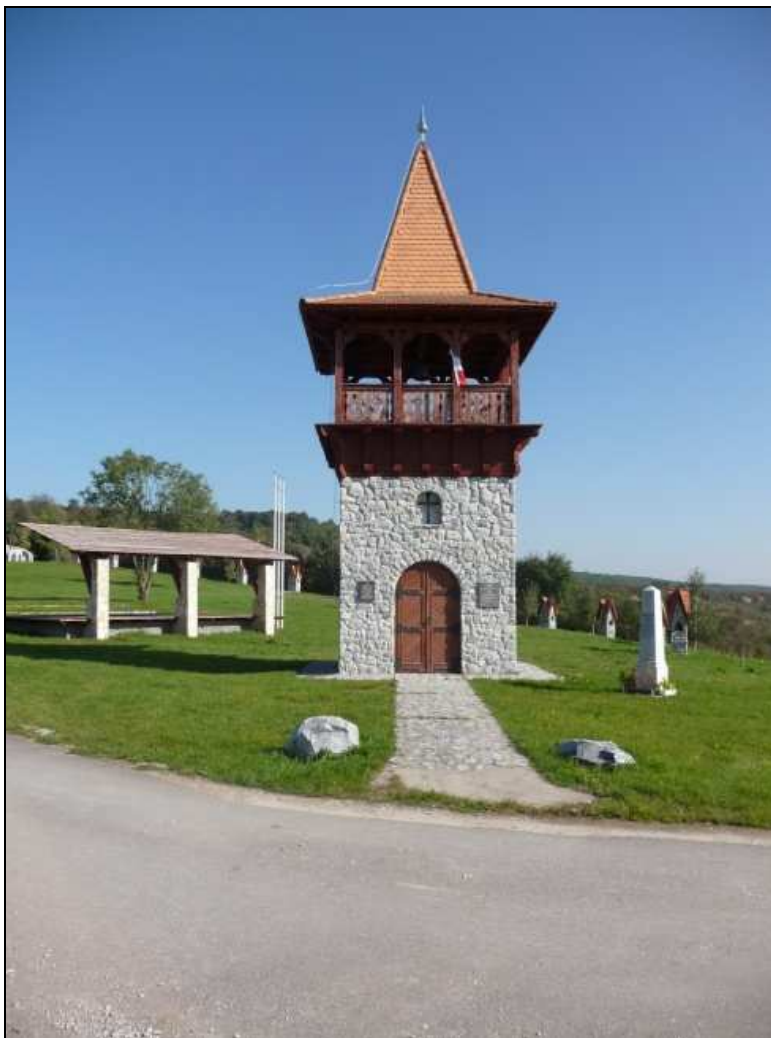
A sírelék a harangtorony mellett