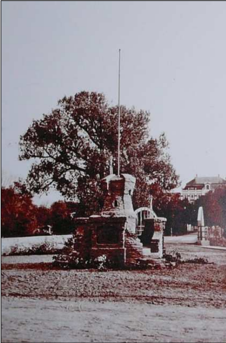
Képek az edelényi országzászlóról