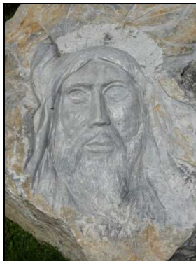
A XV. stáció Jézus domborművével

Összeállításunk végén meg kell említenünk a korábban hivatkozott, Emlékhelyek Edelényben című könyvből kimaradt alkotást. A Sas és kígyó című mű a szakorvosi rendelő (Deák Ferenc u. 6.) homlokzatán nyert elhelyezést 1961-ben az SZTK (szakorvosi rendelő) elkészültének évében. A vörösréz lemezből, domborítással készített alkotás Nyíró Gyula (Szeged, 1924. szept. 28. – Budapest, 2005. ápr. 23.) szobrászművész munkája.