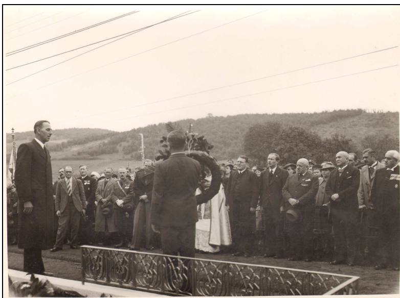
Az ormospusztai országzászló szentelése