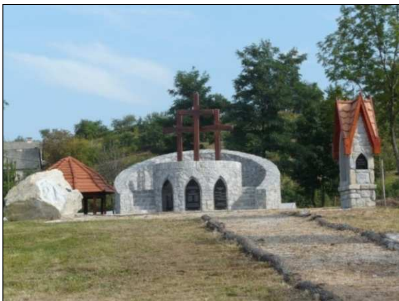
A Golgota távlati képe