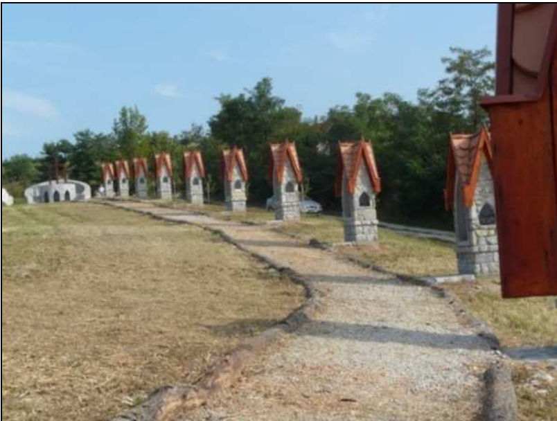
A Kálvária stációi

A Kálvária építését Edelény Hegyközség szervezte, együttműködve Edelény Város Önkormányzatával, az edelényi római katolikus és a görög katolikus egyházközséggel.