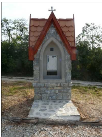
Egy stáció szemből