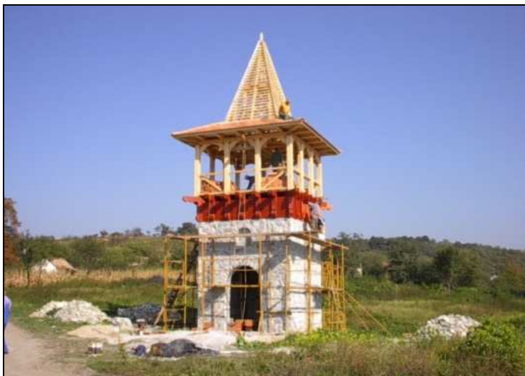
A harangtorony építés közben