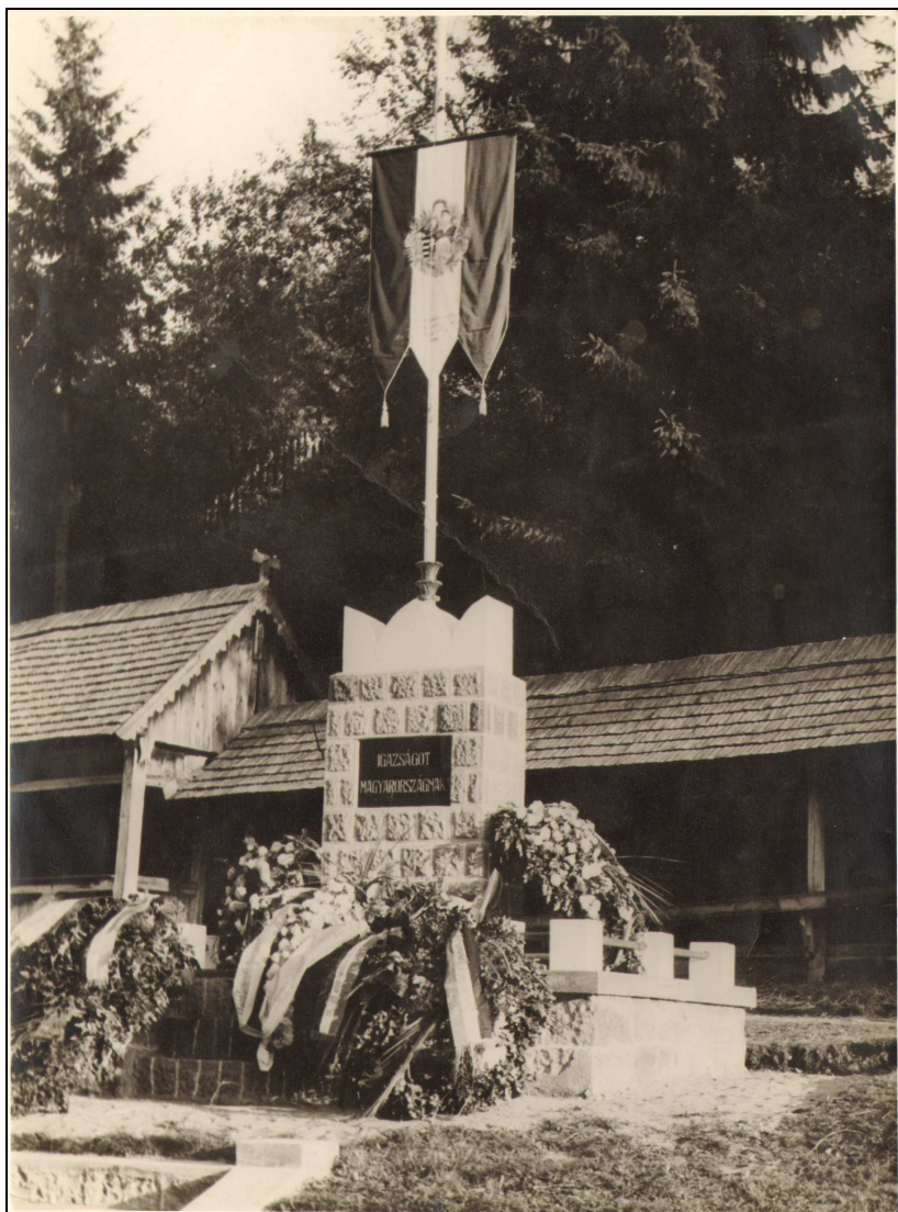
Az ormospusztai országzászló