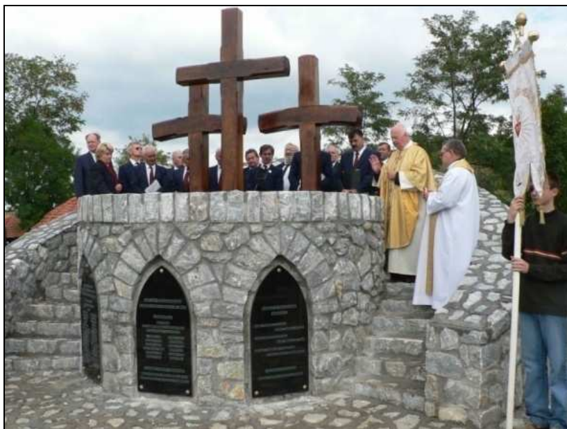
A Golgota szentelése