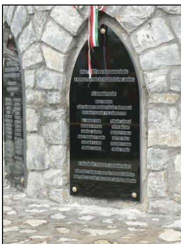
A középső tábla a Golgotán