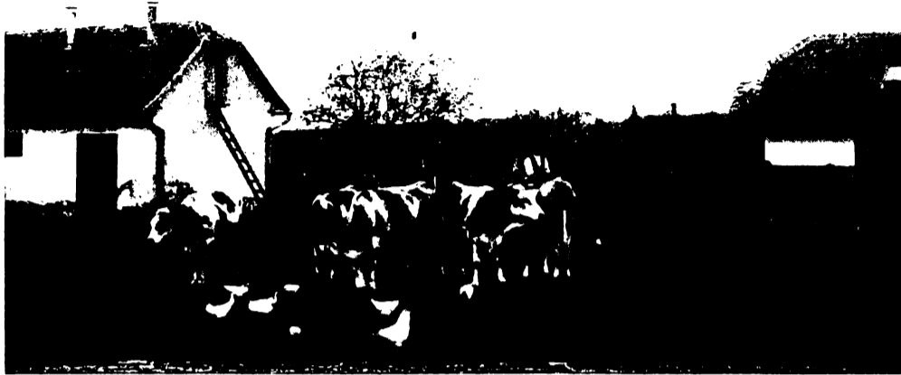
Az iskola tehenészete.

tettek részben barna, részben fehér fűzveszéből. A hallgatók a készített tárgyak felét kapják, míg a többi az iskola értékesíti és a befolyt összeget anyagbeszerzésre fordítja. A tanfolyamok végeztével az iskola kiállítást rendez, rendszerint a lányok háztartási és kézimunka tanfolyamával kapcsolatosan, mely iránt városszerte nagy érdeklődés mutatkozik. A kosárfonás Gyöngyösön azért bír különös jelentőséggel, mert a gyümölcs, szőlő és konyhakerti termények értékesítésénél igen sok kosár szükséges. Így természetesen a