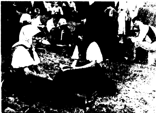
Nyári munkában kifáradt népünk imádsága a sári „Annácská”-nál.

Nemsokára az ország legészakibb részén, a vadregényes Sztrópkón találjuk Bárkányit, ahová a ferenceseket a Gersei Pethő-család hívta meg. Az üldözött magyarság kisebb rajai mind északabbra menekültek, egész a lengyel határig keresve nyugodt helyet e szerencsétlen hazában. Állandó népvándorlás volt ez, a sors ostorától üzött nép bolgongása. Ezeknek lett hitszónoka Bárkányi.