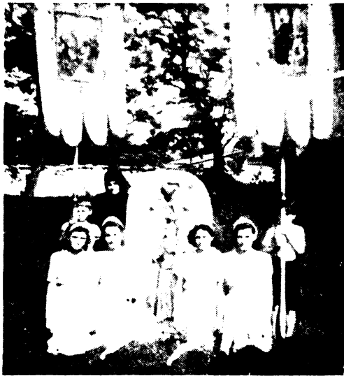
A gyöngyöspüspöki Mária-lányok a Mária-dajkával és a Mária lobogóval.