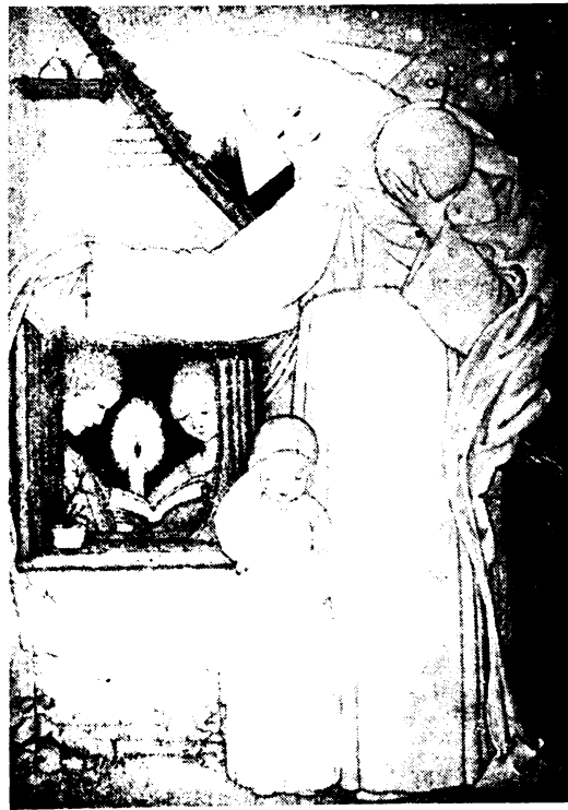
A gondviselő Atya virraszt az igazak reménysége felett.

Az ő uralkodása alatt alapította Szent Benedek dicső rendjét 520-ban! A Gondviselés mérhetetlen áldással gazdagította az Egyházat és emberiséget ezzel a csodálatos alkotással. „A klasszikus kultúrának megmentői és hordozói” évszázadokon keresztül egyszersmind a keresztény munkának, tudománynak, művészetnek, az élő hitnek és a teológiának, a szent életnek, a hit hirdetésnek, az apostolkodásnak, a vértanuságnak, az Egyház nagyságának, az élő Krisztus dicsőségének is örökké erős hordozói, inspirátorai, apostolai, sokszor megmentői, mindig lelkes, kitartó művelői, soha nem csüggedő védői, ragyogó szentjei, és példaadói, bölcs vezetői,