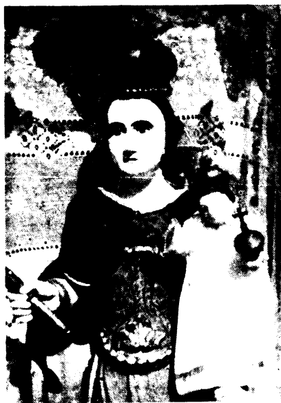
A gyöngyöspüspöki Hordozható Mária.

Ép lorétói vonatkozásából érthetjük, hogy kegyzoborrá magasztosult népünk áhitatában. Már a díszítése, ékszerekkel való felruházása, az imádkozás számlójánál erre a megkülönböztetett szerepére utal. Tisztelete azonban kizárólag a népnél van. Amíg az előkelő földesúr a maga kedvelt templomi Mária-szobrot, esetleg családi sirboltjának szobrát, képét gazdagon ékesítette, szinte kizárólag magának foglalta le, addig a nép utánczó lelkülete megteremtette a hordozható Máriában a maga védőasszonyának tiszteletét.