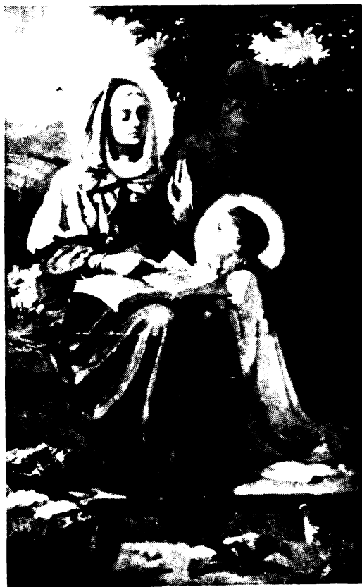
Takács József: Szent Anna oktatja a kis Szület.

Amikor a felkelők elvonultak a letarolt vidékről, Bárkányi visszatért hegyi rejtekeiből és a kolostor rendbehozatalához látott. De alig melegedtek meg az épülő fészekben, újra rázúdultak a csapatok a még alig éledő vidékre. Kelet felé menekült