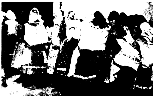
Bugyorral a hátán érkezik egy zarándokcsoport.

— Népies, hazai nyelven meghívó leveleket írtam minden községbe és minden helyre, könnyek