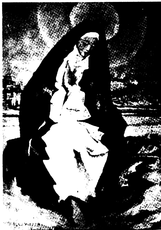
Miskolczi: Szent Margit imába mélyedve.