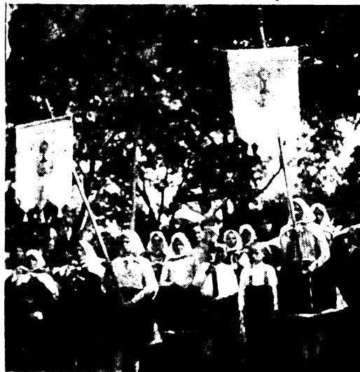
Bücsücsoport köszönti a kegyhelyet.

Ismét csak Bárkányi életéből látjuk, mire volt képes a hatalmas alkotó erő. Mialatt még a magyar Délvidéken a fölmentő sereg a törökkel viaskodott, máris megindult az építő munka. Bárkányi vette vándorbotját, székére rakta az egyházi szereket: egy oltárkövet, misékönyvet és a legszükségesebb