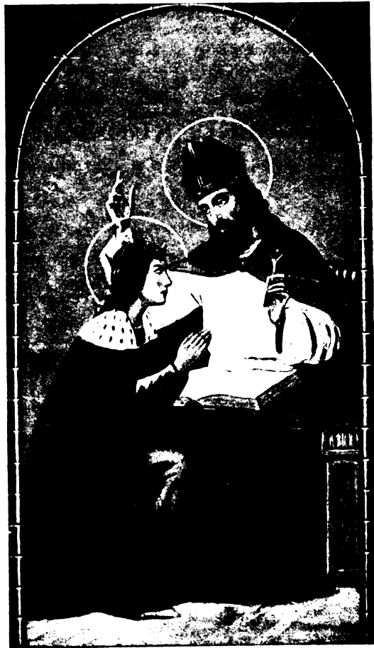
SZENT GELLÉRT PÜSPÖK INTELMEKET AD SZENT IMRENEK.

Családatyai kötelességeinek példászerű teljesítését fia neveléséből látjuk. Eleven mintául állott előtte egész életmódjával, Intelmeiben pedig olyan oktatásokat adott neki, hogy ezek például állhatnak minden atya és minden nemzetnevelő előtt. De a szeretet parancsait is tel-