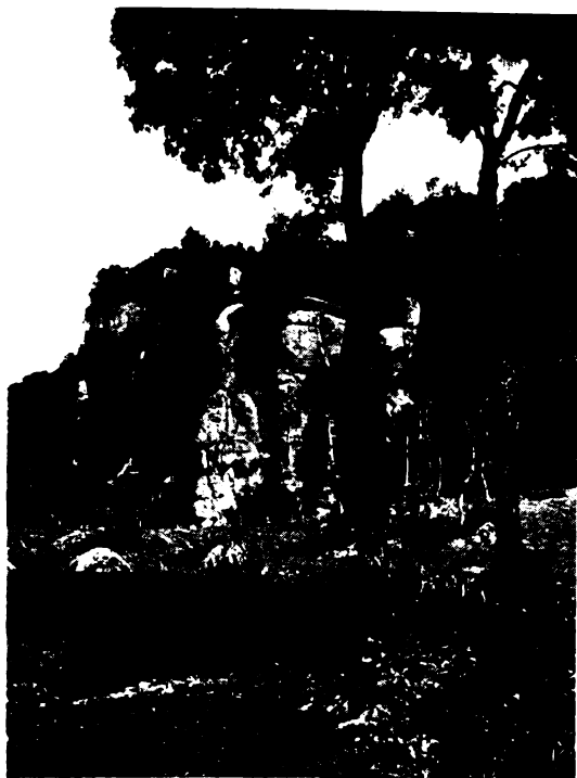
Ezen az 1128 m. magas sziklatetőn kapta Szent Ferenc Atyánk a sebhelyeket.

Alverna az etrusiai Appenninek egyik leg-szebb és legvadregényesebb kiemelkedése. Csodálatos természeti szépségekben gyönyörködhetik itt az utazó. Meredek sziklák tövében évszázados fák suttognak elmúlt történelemről. A kanyargós hegyi ösvényeken elfáradt vándort enyhe szellő simogatja, csicsergő madárcák ezrei hangolják fel a lelkét. Nagyszerű kilátás nyílik a távoli, égbenyúló kék magaslatokra. Szent Ferenc csodálatosan tudta kiválasztani a természetnek a legszebb vidékeit. Az ember megcsodálja a rieti völgyet, Grecciót, Fonte Colombót, Subiacót, de talán a legjobban elámul Alverna csodás szépségének láttán.