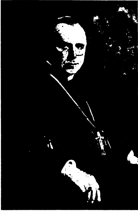
csanádi érsek-püspököt kísértük utolsó földi útjára az elmúlt napokban. Egyikét a magyar katolikus élet utolsó félszázada legnagyobbainak.

Prohászka mellett a magyar katolikus megújulás leghatásosabb apostola, a magyar szellemi mozgalmak irányító lelke, nemzetnevelésünk mestere, az ifjúság barátja, a megcsonkított magyarság vigasztalója szállt benne a sírba.