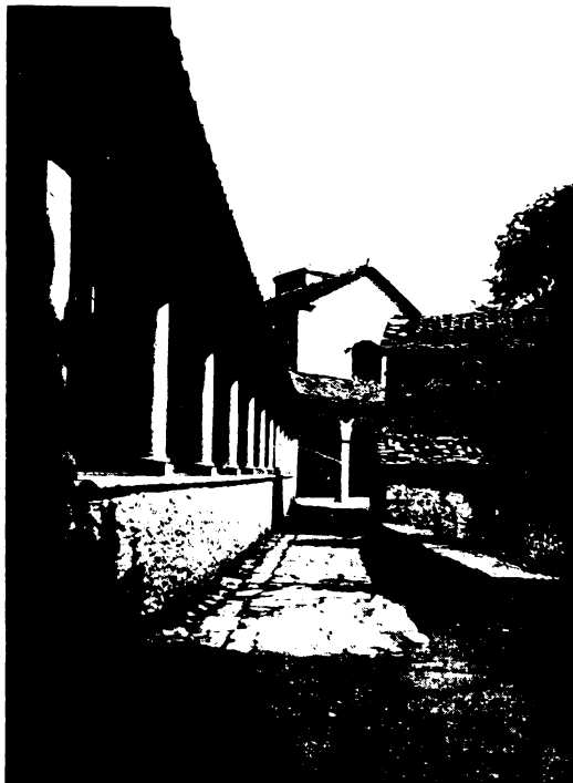
Folyosórészlet és a bazilika homlokzata Alverna hegyén.

P. Gemelli Ágoston, a nagy ferences író mondja egyik könyvében, hogy ha a „jámbor zarándok Szent Ferenc titokzatossági érzésébe akar behatolni, felhág a vad Alverna meredekségein“. Valóban a zordon Alverna a maga szépségével és fenségével többet tud mondani Szent Ferencről, mint az összes írott könyvek, csak meg kell érteni. Alverna meglopta Szent Ferenc lelkét, magába szívta szellemét és évszázadok óta hirdeti és beleloppja az ember lelkébe Umbria lelkes Vándorának a titokzatos lelkét. Itt minden órára beszél; minden fa, minden vi-