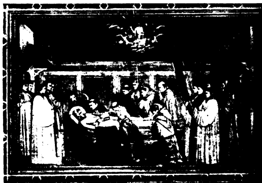
Giotta: Szent Ferenc a halálos ágyon testvérei körében.