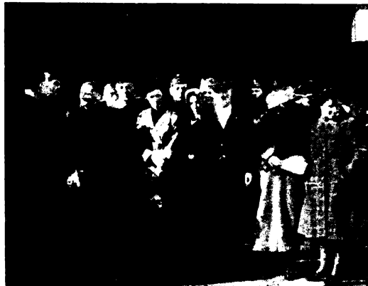
Rendtársaink megérkeznek a keleti frontról. Szeretteik és rendi testvéreik fogadják őket a pécsi állomáson.