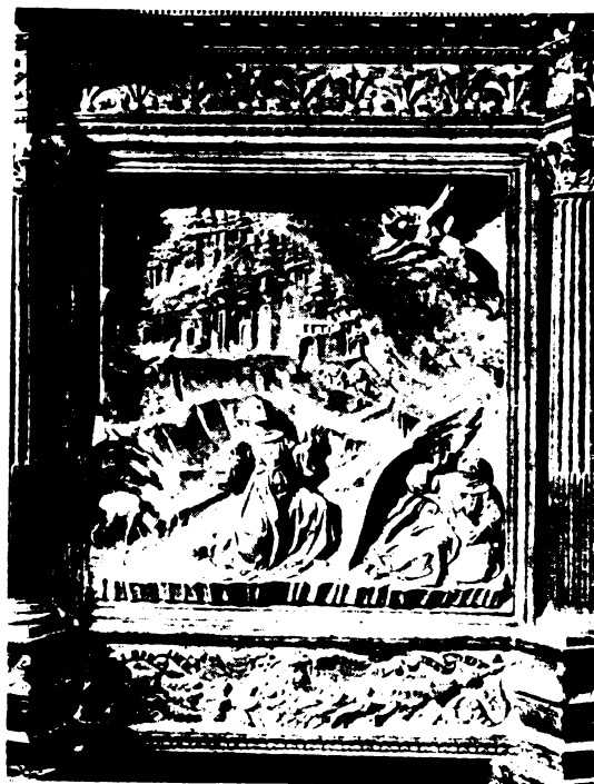
Benedetto de Maiano: Szent Ferenc Atyánk a szent sebhelyeket kapja az alvornál jelenésben.

Eddig fejtegetésünkből kitűnt, hogy az Egyház