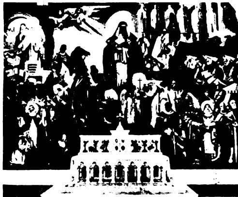
Kontuly Béla: Árpádházi Szent Margit kegyoltára és freskója a szentdomonkosrendi templomban Budapesten.

Nem céltalan és nem időszerűtlen az ő éppen napjainkban való tökéletes megdicsőülése. Győzelemre hív és biztosít erről bennünket, ha a nyomdokain járunk. Nem lehet őt követnünk, ha nem ismerjük meg korát és korának magyarságát. Ha rá nem döbbenünk a tatárdúlás borzalmának legbensőbb okára, a gőg és hatalomimádás szédületében önmagát megosztó magyarság bűnére. — Esztelen és értelmetlen volt ez mindenestül. Megtermette a maga gyümölcsét, szinte elvérzett és földdel egyenlővé tette-