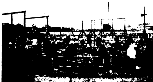
Körbiceiklín robognak mesebéli országukba, nyilván Tündérországba.

Ennek a nevelő-iskolának a mestere egy barát! Ha jól megfigyeled, minden gyermek ajka egy nevet mondogat, kiált százszor is, ezerszer is egy délután: Szilveszter atya! Szilveszter atya! Talán csak az édesanyjukat hívogatják többször... Sokan még őt sem, mert csak este látják fáradtan, napi mun-