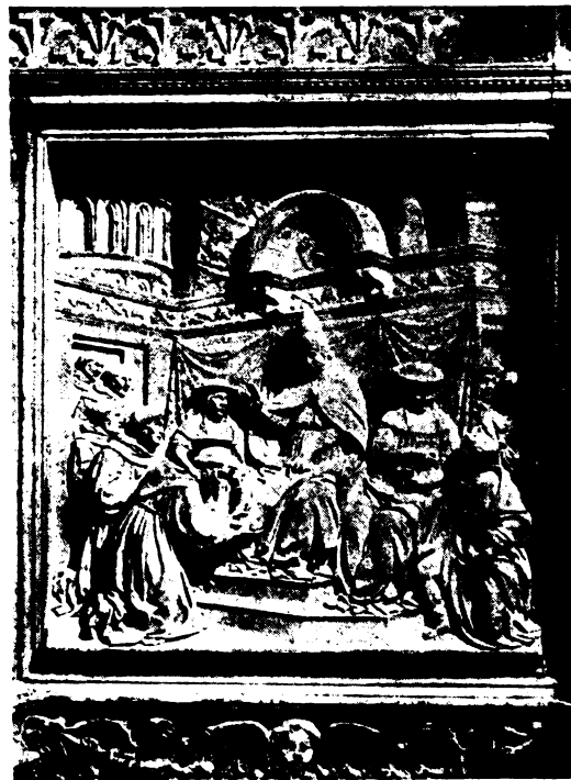
Benedetto da Maiano: III. Hónor pápa jóváhagyja Szent Ferenc Atyánk szabályait.

Súlyosan tévednek azok, akik önkényesen az Egyházat valamilyen rejtett, láthatatlan közösségnek gondolják; de azok is csalódnak, akik azt vélik, hogy az Egyház csupán emberi intézmény, melyet csak a fegyelem, a külső szertartások tartanak össze, de amely nem forrása a természetfeletti életnek. (Folyt. köv.)