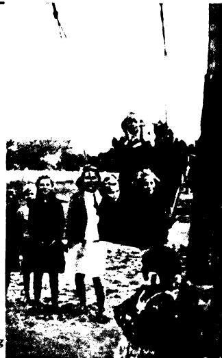
Hinta-palinta... — éneklék Mosolyország hatvani szigetén.

kától, napszámtól összetörten... Hát ő ennek a pár négyszögöles Paradicsomnak a lelke és királya! S ami itt nevelő-hatás és zsenialitás, az ő tudománya! Nem csoda, hogy a MÁV szociális szellemtől áthátozott központi és helyi vezetősége még a csillagot is lehozná, csakhogy krisztusibb és magyarabb legyen a jövő vasutasnemzedék, melegebb s derűsebb legyen az otthon, boldog gyermekmosolytól ragyogjon az egész Föld!