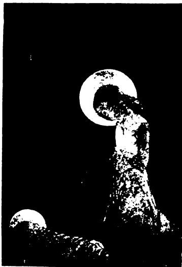
Beckert: Szűzanya kincse.

Az adventi szürkületben ébredő rorate hajnalokon ezek a vezéralakok legyenek kísérőink a sötét utakon épűgy, mint az élet kísértésekkel telített útban útjain. Az ő vezetésűkkel tanuljuk meg várni a boldog reményt, az Ur eljövételét, a mi boldog karácsonyunkat, az Istenország beteljesedését bennünk!