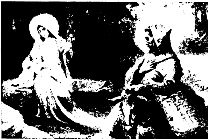
Szent Ferenc Szűz Máriával és a kis Jézussal társalog (Fioretti).

A hálájuk szinte kifogyhatatlan. Volt is olyankor annyi krumpli meg tej a háznál, hogy alig tudtuk már hová tenni, mikor érmet osztogattam. Már azt is mondták, maradjak itt náluk bátyuskának, mert nekik, az ő falujukban úgy sincs. Gondoltam magamban, mint misszionárius, még szó eshet erről is, mert kiáltó nagy a lelki igénylés. Ők pedig epedve várják és jó szívvel fogadják. A fiatalság kicsit nevelten a vallási dolgokban, de imádkozunk, hogy küldjön az Úr munkásokat az Ő aratásába, mert az aratni való sok, de nincs munkás. Az Isten Anyját igen tisztelik. Azért kérjük értük a Szűzanyát, hogy Szent Fia, Krisztus Király uralmában ennek a népnek, sokat szenvedett szegény népnek a szívében, Sok testvéri szeretettel üdvözlöt minden magyarnak.