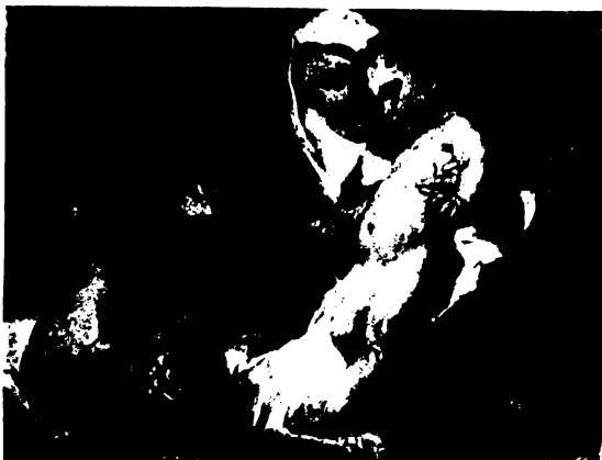
Benczur: Nyulas Madonna.

De a földi méreteket szinte túlhaladó nagy munkájukban itt-ott rajuk száll az emberi gyarlóságnak ragadó, finom hamuja is és kézzelgél valljuk, hogy nem minden gyarlóság bocsánatos bűn, az olyan éretlen, olyan nyíltsággal ellenmondnak azok hibáinak, akik jobban örülnének egy bűnő négy, mint kétszázéves fejedelmeknek.