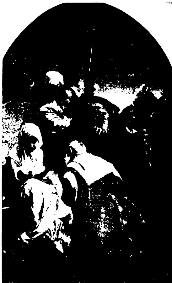
Benezúr: A szent királyok hódolata.

Amíg egy épkezláb ember él e honban, amíg szeretet pislog a szívekben, nem lehet igazi rokkant katona ebben a hazában. Jaj, ha megtagadjuk a szeretetet! Most minden másképp lesz! Nemcsak a hősiesség be-