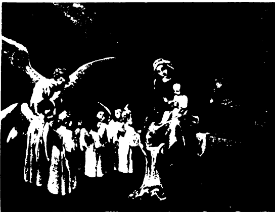
Rossmann: Az angyalok hódolata.