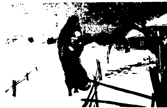
„És övei be nem fogadák őt”.

Aldás szállt élet nekünk minden korban és minden nyelven minden nép és minden nemzet részéről.