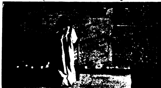
Egy Ave Mariatestvér imádkozik Don Orione sírjánál.