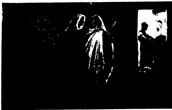
Rob. Leinweber: Szállást keres a Szent Család.

Szervezzük meg mi is a szálláskeresés szép szokását! Szerteljük meg vele otthonunkat, tegyük Isten templomává családunk szentélyünket!