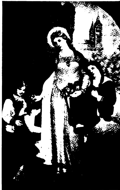
A szegények szentje.

Szent Erzsébet szelleme bekiált a viharos magyar éjtszakába: Magyar Ifjúság! Szeresd az Isten és tedd meg kötelességedet! Az ifjúság legyeny szerény és fegyelmzett, de ez a fegyelmzettég ne a „kivagyok, mivagyok” hányavetiségben, hanem az erkölcsi értékek nagybecsülésében és