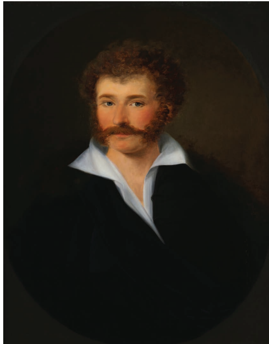
Id. Pesky József: Kisfaludy Károly arcképe , 1830 Olaj, vászon. 76,6×60,5 cm. Jelzés nélkül. Magyar Tudományos Akadémia, Művészeti Gyűjtemény, ltsz.: 7