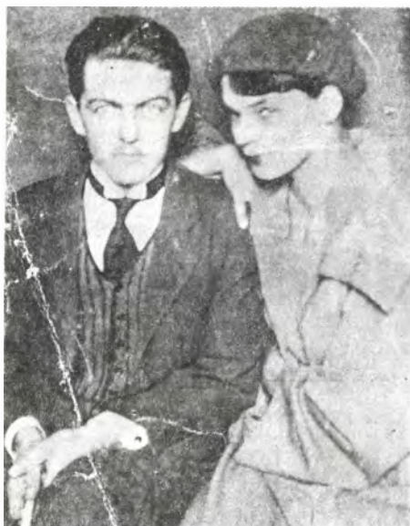
Kollégiumi színelőadás női szerepében (1924)