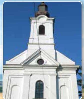
A Szóládi Református Egyházközség temploma