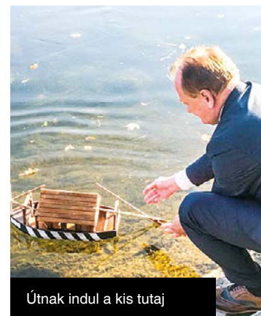
Útnak indul a kis tutaj