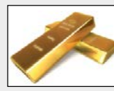
Gold Cover Kft.