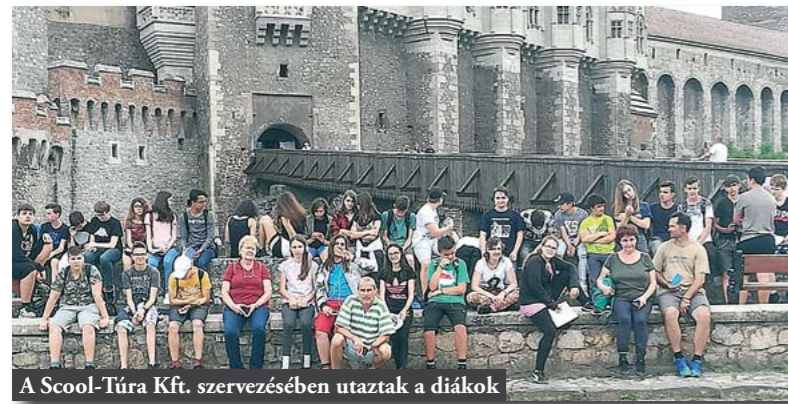
A Scol-Túra Kft. szervezésében utaztak a diákok

Május 27-én indultunk Erdélybe a Határtalanul, hivatalos nevén: „Tanulmányi kirándulás hetedikeseknek” program keretében, 40 diákkal és négy pedagógussal.