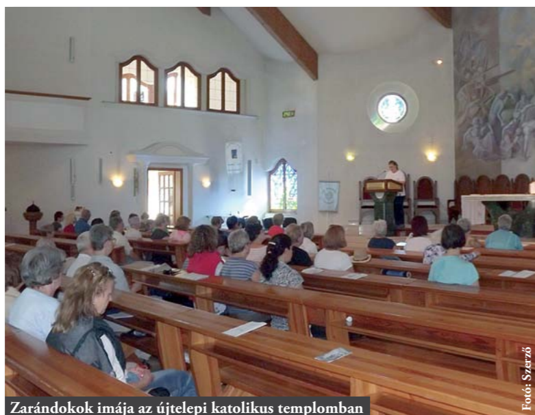
Zarándokok imája az újtelepi katolikus templomban

Az újtelepi Szent István-plébániatemplomhoz is érkeztek zarándokok részben a Hősök tere felől, a temető mellett, a megtett távolság gyalog közel 5 kilométert tett ki. Rövid pihenő után folytatták az útjukat a pestszentlőrinci Mária Széplőtelen Szíve templomhoz. Az ide megtett távolság 13,5 kilométer volt. Továbbá