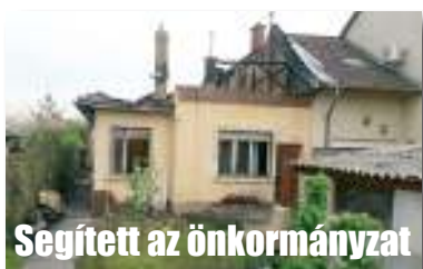
Segített az önkormányzat