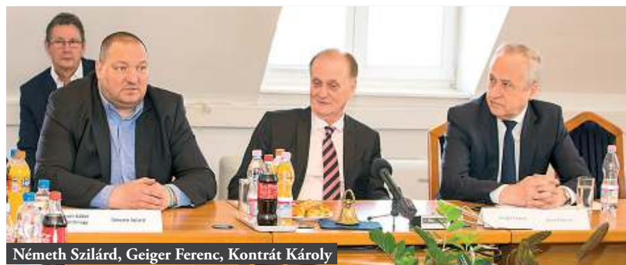
Németh Szilárd, Geiger Ferenc, Kontrát Károly

elvárják, hogy a biztonságukat szavatolják, az új kapitánysággal pedig ez a kívánalmuk teljesíthető. Ma a biztonság a legfontosabb közösségi érték, amely meghatározza az emberek mindennapjait – fogalmazott a sajtótájékoztatón Kontrát Károly, a Belügyminisztérium parlamenti államtitkára.