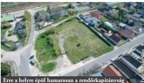
Erre a helyre épül hamarosan a rendőrkapitányság

A Belügyminisztérium hamarosan kiírja az új kapitányság építésének közbeszerzést, amely a tervek szerint 2019-re készül el.