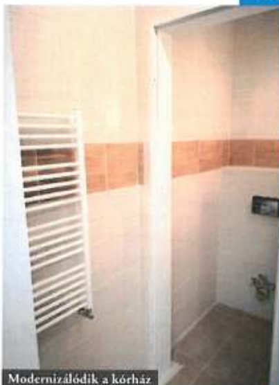
Modernizálódik a kórház