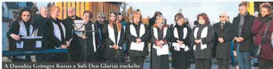
A Danubia Gyöngye Kórus a Soli Deo Gloriát énekelte