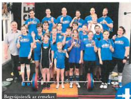
Begyűjtötték az érmeiket

A Budapesti Súlyemelő Szövetség és a RAGE Sportközpont február 3-án rendezte évadnyitó versenyét, a Tavaszváró Kupát. A soroksári súlyemelők 23 érmet gyűjtöttek, melyből 17 aranyérem volt.