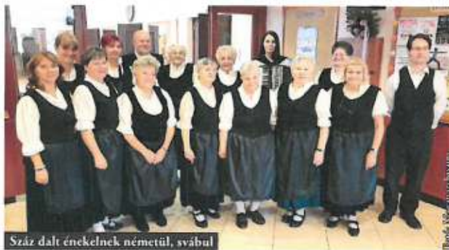
Száz dalt énekelnek németül, svábul