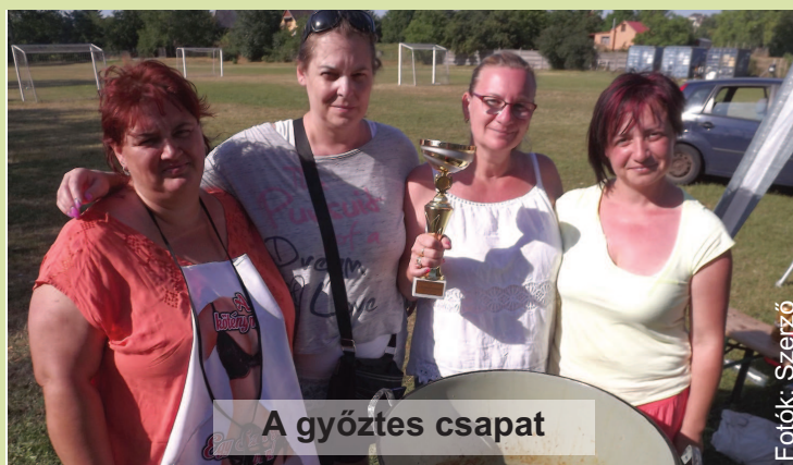
A győztes csapat