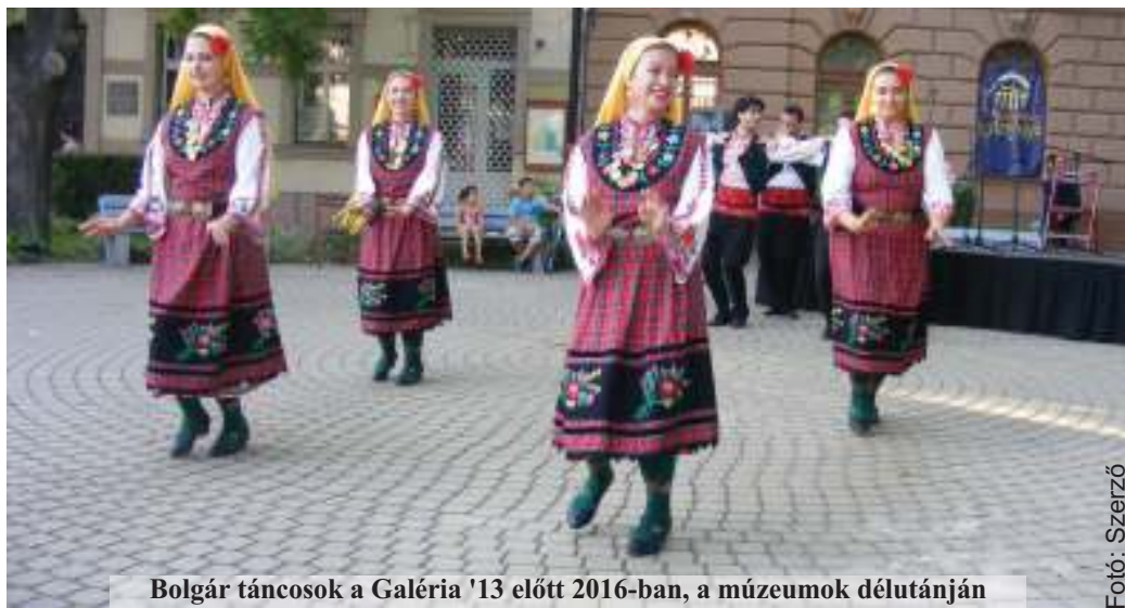
Bolgár táncosok a Galéria '13 előtt 2016-ban, a múzeumok délutánján