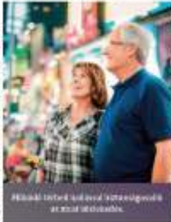
Hallás: fontos lépés a támogatás az időskorban.

A fokozatosan romló hallás az érintetteknek sokszor alig tűnik fel, sőt idővel megszokottá is válhat ez az állapot. Akí rosszul hall, hajlamos lehet akár a környezetét is hibáztatni: sutyorognak, nem beszélnek érthetően, hadarnak. Az ebből eredő konfliktusok, sértettség, a meg nem értettség akár a hozzátartozóktól való elfordulásig fajulhat.