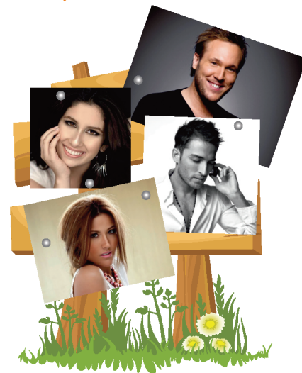
A műsorváltoztatás jogát fenntartjuk!

A rendezvény ideje alatt folyamatosan árusok és büfé várják a látogatókat.