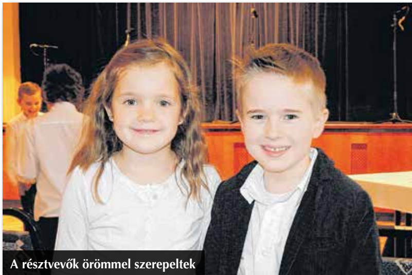
A résztvevők örömmel szerepeltek