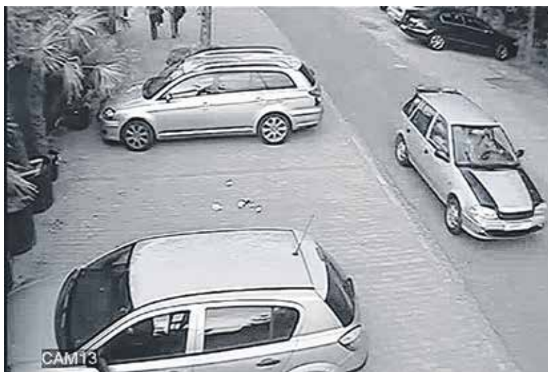
Ezt az autót keresik

A gyilkosság napján a nő még hazament a munkából, majd átöltözött, és futni indult. Nem ért vissza a megszokott időben, ezért kezdte keresni a családját és a rendőrség. Végül hajnalban egy bozótban,