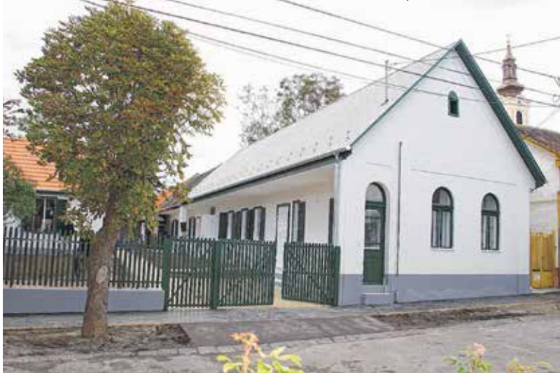
A Soroksári Napok keretében, sváb muzsika- és énekszó mellett adta át az önkormányzat a sváb tájházat a Német Nemzetiségi Önkormányzatnak.