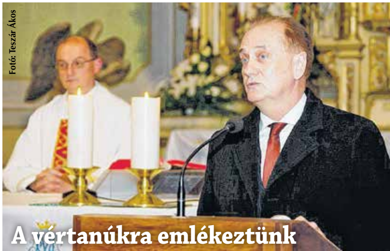
A vértanúkra emlékeztünk

Az 1848–49-es szabadságharc végét jelentő világosi fegyverletétel után, október 6-án, a haditörvényszék ítélete alapján, I. Ferenc József jóváhagyásával Aradon kivégeztek 12 magyar tábornokot és egy ezredest. A nemzet vértanúi lettek.