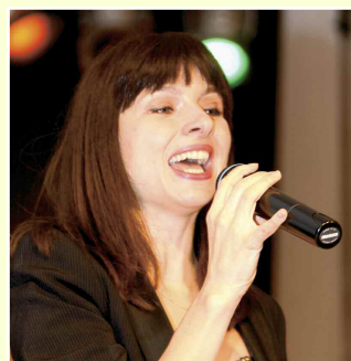
Zséda gyönyörű hangjával varázsolta el mindenkit