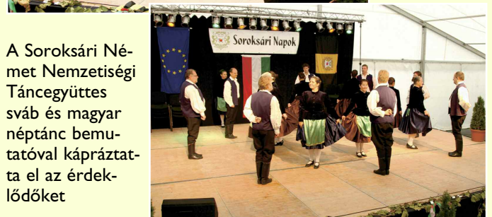
A Soroksári Német Nemzetiségi Táncegyüttes sváb és magyar néptánc bemutatásával kápráztatta el az érdeklődőket