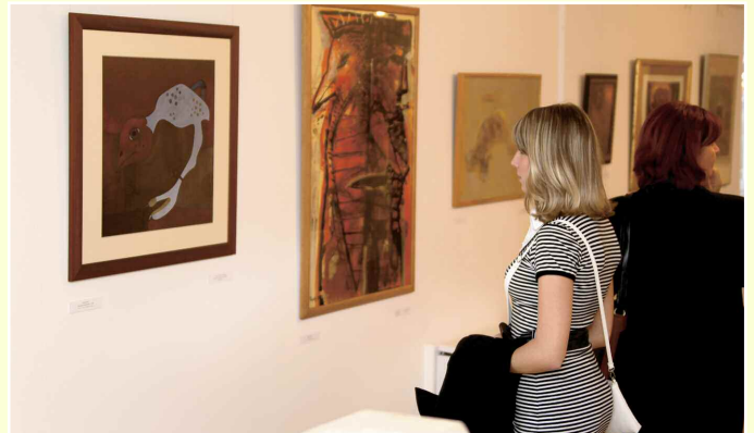
A soroksári alkotók munkái immár állandó kiállításon tekinthetők meg a Soroksári Képtárban