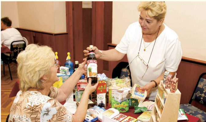
Az „Egészségnap” keretében sokan vettek részt az ingyenes szűrővizsgálatokon és tanácsadáson