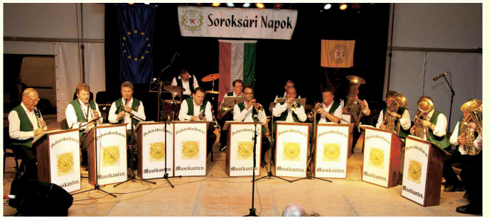
A szüreti bálón a Schorokscharer Musikanten Zenekar szolgáltatta a talpalávalót