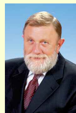
Szrimác Ferenc Civil Egyesület lista