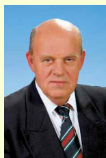
Fuchs Gyula Civil Egyesület 4. vk.