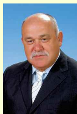
Dr. Kolosi Ferenc Civil Egyesület 6. vk.