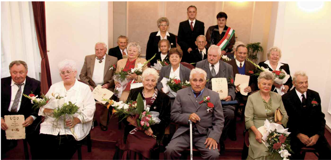
2010-ben is szép ünnepség keretében jubiláltak az 50 éve házasodott párok