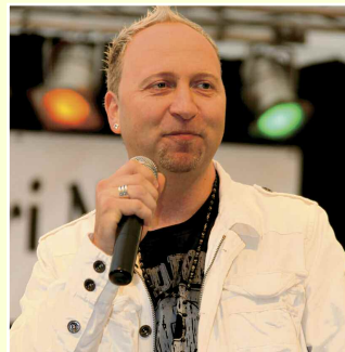
Klemy szokás szerint magával ragadta rajongóit