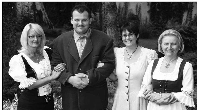
Zusammengestellt von Christina Páll Hoffmann

Ezúton szeretnénk köszönetet mondani azoknak a soroksári választópolgároknak, akik regisztráltatták magukat a német kisebbségi választójegyzékbe és a választás napján szavazatukkal megtisztelték bennünket bizalmukkal!