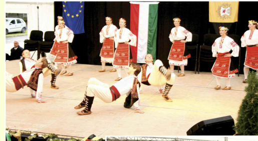
A Soroksári Bolgár Kisebbségi Önkormányzat vendégei idén is fergeteges táncműsort adtak