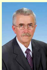
Mikó Imre Civil Egyesület 3. vk.