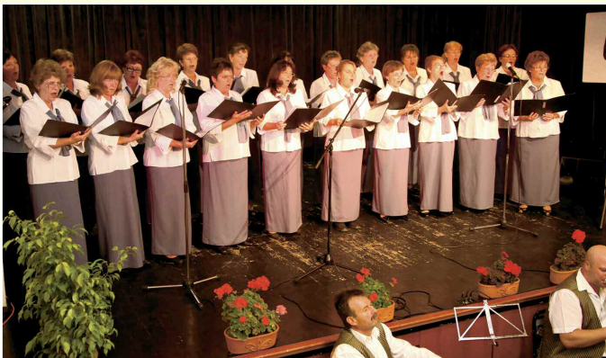
A Díszelőadáson fellépett a Soroksári Pedagógus Énekkar is