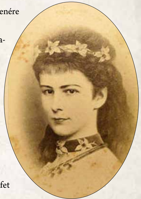
Sissi: A kiegyezési tárgyalások idején közvetítő szerepet vállalt. Megtanult magyarul.

A 12 pont. Tartalmazza mindazt, amit a haladás és függetlenség érdekében el kellett fogadni.