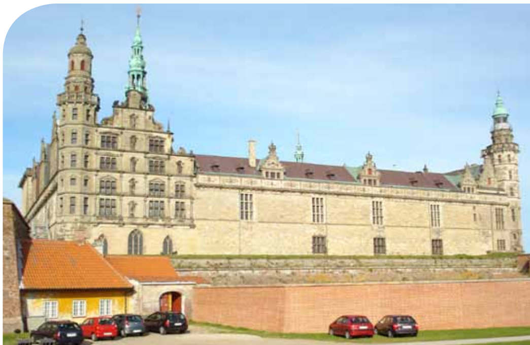
Helsingor, Hamlet kastély