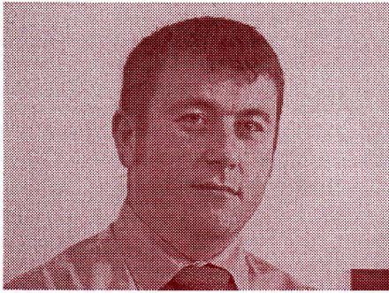
Kedves karcfalviak és jenőfalviak!

Az esztendő vége arra kötelezi a választott tisztviselőt, hogy számot adjon a lezáruló időszakról választóinak, Önöknek. Egy évvel ezelőtt mindannyian tele voltunk tervekkel, elhatározásokkal, reményekkel. Eljött az ideje a számvetésnek. Én úgy látom, hogy mindannyiunk számára a 2006-os év már nem csak a tervezések éve volt, hanem a konkrét megvalósításoké is. Az év elején tett ígéreteket beruházások, fejlesztések támogatása terén sikerült betartani, sőt némileg túlszárnyalni. A legfontosabbnak azt tartom, hogy Csíkkarcfalva polgárai felismerve a haladás lehetőségét, folytatták az előző években megkezdett fejlesztési folyamatot.