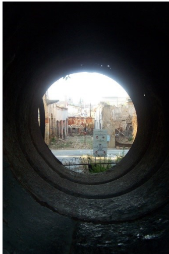
ENSZ által felügyelt terület Nicosiában – egy ciprusi görög barikádról fényképezve (saját felvétel, 2003)

Az inváziót követően az ENSZ tűzszüneti felhívásainak Törökország nem tett eleget és fokozatosan haladt előre a sziget belseje felé. Nagy-Britannia nem lépett közbe, mivel a szigeten található két szuverén bázisát a támadásoktól nem kellett féltetnie. ENSZ határozatok sora törte meg a csendet 1974 és 1977 között, hiszen maga a párbeszéd hiányzott. Először 1977-ben, majd pedig 1979-ben született egyezség abban, hogy a megoldás egy bi-kommunális , bi-zonális rendszer létrehozásában rejlik. Az alapok megváltak, a későbbi tárgyalások akadoztak és provokációk hada (légtér megsértése török katonai repülőgépek által, görög ciprióta civilek elhurcolása török területre a Buffer-zónában) akadályozta a párbeszéd folytatását. Minden eddigi ENSZ-főtitkár dolgozott a konfliktus megoldásán, de egyikük sem sikerült megoldania azt. A stressz és konfliktuskezelés szintjén viszont elmondható, hogy az ENSZ eszközrendszere képes fenntartani az elkényelmesedett patthelyzetet, amibe a szembenálló felek kényszerültek, hiszen 1974 óta kisebb incidensektől eltekintve nem volt olyan helyzet, ami rontott volna a kialakult „status quo”-n. Kijelenthető: a két országrész közötti közeledésben a nemzetközi közösség próbált javítani a folyamatos párbeszéd fenntartásával.