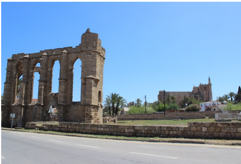
Keresztény templomromok a megszállt Famagustában (saját felvétel, 2014)

közötti kulturális különbségek és azok erőltetett „anyaországi” nacionalista hangsúlya idézte elő. Itt szerepe lehet az etnocentrizmusnak, ami fogalmi szinten a saját nemzetet, etnikumot vagy etnikai csoportot, fajt tekinti saját világának középpontjának, és minden más, a bűvköréből kieső csoport vagy etnikum viselkedését, értékét ehhez viszonyítva ítéli meg, ennek megfelelően alacsonyabb rendűnek, megvetésre méltónak tart. Ez utóbbi az ún. jobb oldali tekintélyelvűséggel áll szoros kapcsolatban. 3 Ehhez társulhat a szóban forgó etnikum területe körül forgó vitás helyzet, de a kulturális etnocentrizmus kirekesztő lokálpatriotizmusán kívül a „végzetes etnocentrizmus” gondolata is megfogalmazódhatott az 1974-es török inváziót követő leszámolások és fogolygyilkosságok okán. Az észak ciprusi területre elhurcolt görög ciprióta közösség harcoló és nem harcoló tagjai még feltételezett holtukban is aligha kerültek elő. Ennek a vitás kérdésnek a rendezése és a tömeggyilkosságok elismerése nyitókulcsa lehet a konfliktus megoldásának.