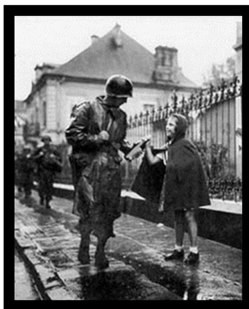
1. sz. kép: A „Pezsgős Kampány”

This study is a short summary of the Allied invasion of Southern France between 15. August 1944 and September 14. The operation's early name was Anvil until 24 June 1944 when the action was renamed to Dragoon. It was one of the most complex amphibious and airborne military operation in World War II but it was overshadowed by the earlier and larger Operation Overlord.