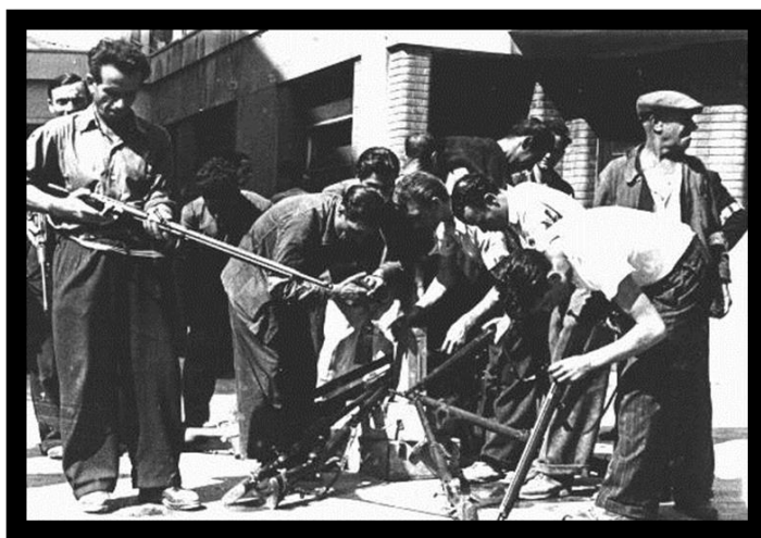
2. sz. kép: Marseilles-i felkelők gyűjtik fegyvereiket

elég ereje volt ahhoz, hogy egyszerre támadja meg a két várost: Toulont két gyalogos hadosztállal, Marseille-t pedig egygel, amiket harckocsikkal és különleges alakulatokkal erősített meg. 68 A német védelem Toulonban 18.000, 69 Marseille-ben 13.000 katonából állt, 70 de a műszaki akadályok a szárazföld felől kevésbé voltak kiépítve. 71 Végül 28-ára mindkét várost sikerült elfoglalni súlyos harcok árán. A német védők végül a Führer parancsa ellenére kapituláltak. A franciák Toulonban 2.700, Marseille-ben 1.800 embert vesztek, míg német oldalról összesen 28.000 ember adta meg magát. 72