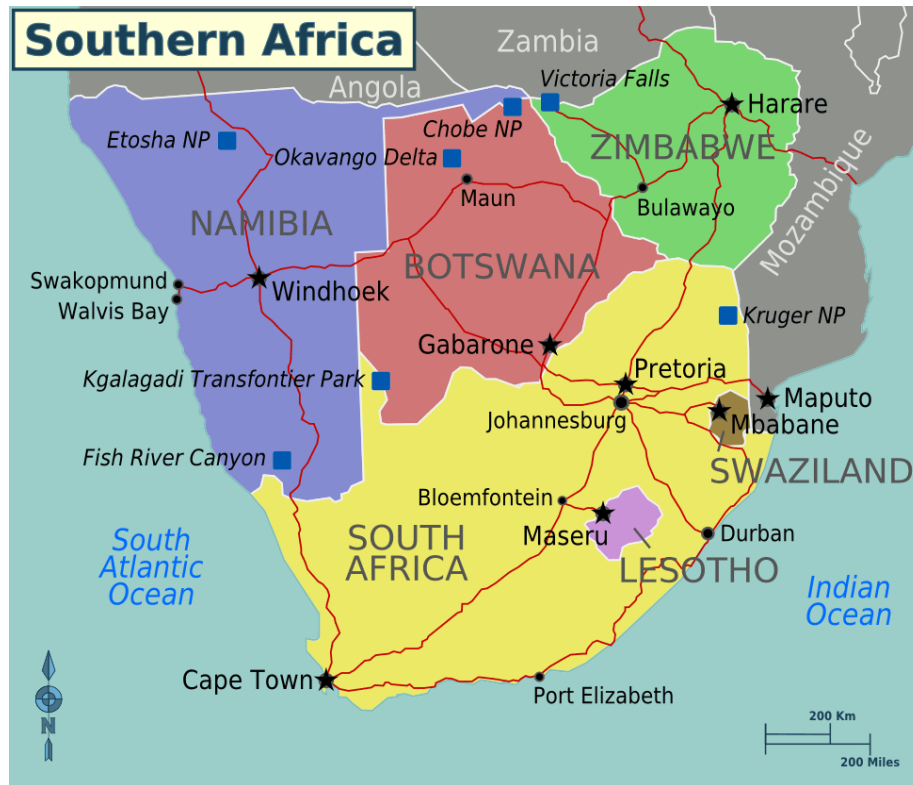
1. sz. ábra A Dél-afrikai Köztársaság geostratégiai helyzete 3