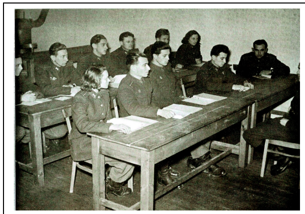
1. számú kép: Oktatás az Őrsparancsnokképző Tanosztály képzésén

Az „ Őrsparancsnokképző Tanosztály ” Budapesten a Budapesti Főkapitányság szervezetében működött, közvetlen miniszteri irányítás alatt. A tanosztály egy zászlóaljat alkotott, amely 1–5 századból állt, a kiképzés részleteit külön rendelet szabályozta.