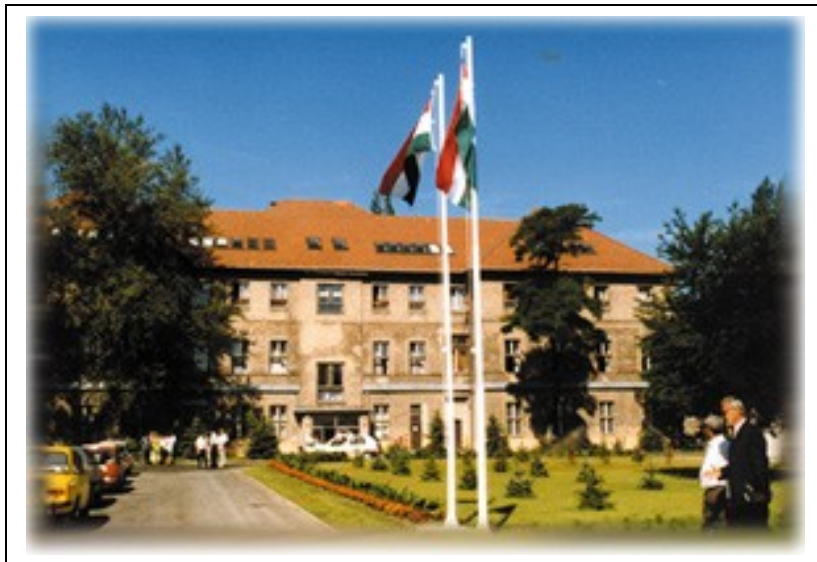
5. számú kép: A Budapesti Rendőr Szakközépiskola

1994-ben az önálló Szombathelyi Rendőrtiszthelyettes-képző Iskola és a Szegedi Rendőrtiszthelyettes-képző Iskola megszűnt. A Szombathelyi a Budapesti, a Szegedi pedig a Miskolci Rendőr Szakközépiskola tagozataként végezte tovább a rendőrképzést. Később 1996-ban a csopaki iskola, valamint a szegedi tagozat önálló szakközépiskolává alakult.