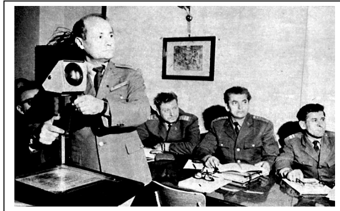
3. számú kép: Tanóra (1975.)

A budapesti „BM Rendőrképző Iskola” 1976-1980 között Csepaki Kihelyezett Tagozatán úgynevezett „gyorsított képzés” keretében négy hónapos rövidített tanfolyamokat hajtott végre. Egységes (közrendvédelmi és közlekedési) képzésben 928 fő, a budapesti iskolán szakosított (közrendvédelmi őr-járőr, valamint közlekedésrendészeti forgalomellenőrző járőr) képzésben 1475 fő vett részt. A különböző módosítások eredményeként az alapfokú rendőrképzés időtartama ismételten tíz hónap lett. Ezen belül a tanintézeti képzés időtartama 5–7 hónap között váltakozott. A fennmaradó időt a már véglegesített, de ki nem képzett rendőrök „gyakorló szolgálat” címszóval az idegenforgalmilag frekventált, illetve nagyobb létszámihiánnyal küszködő rendőri szerveknél létrehozott „gyakorló őrök”-ön teljesítették. Az országban 22 gyakorló őr működött, egyedül Budapesten nem került létrehozásra. Budapesten a különböző kerületekben teljesítettek „megerősítő” rendőri szolgálatot.