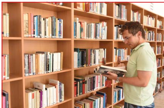
Folytatás az 1. oldalról

Az Óbudai Platán Könyvtár idén nyáron nyújtotta be először pályázatát, melyet elismert szakmai bizottság értékelt. A bizottság javaslata alapján a Minősített Könyvtár címet Fekete Péter kultúráért felelős államtitkár adományozza az Óbudai Platán Könyvtár számára, amit 5 évig birtokol-