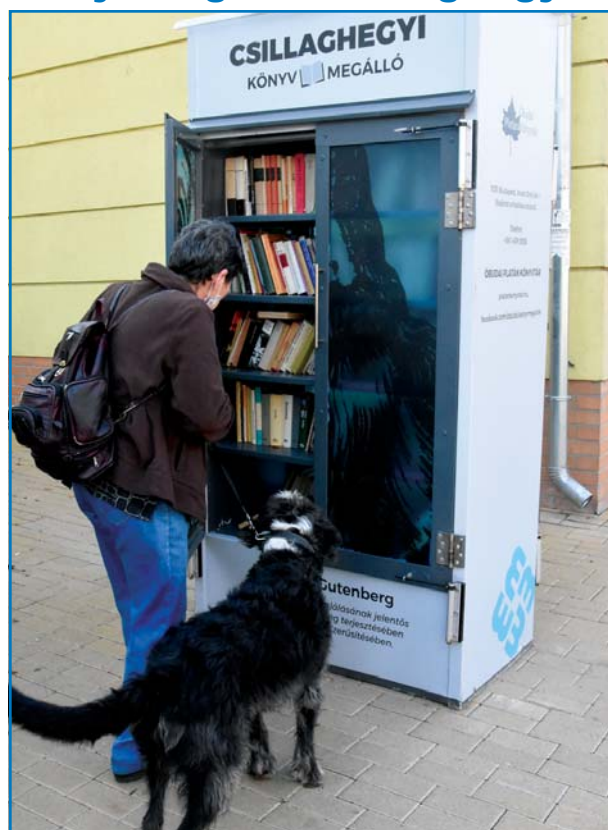
Sok könyvbarát örül a közelmúltban átadott csillaghegyi KönyvMegállónak a Mátyás király úton