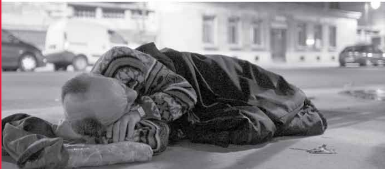
Bús Balázs polgármester Óbuda-Békásmegyer Önkormányzat