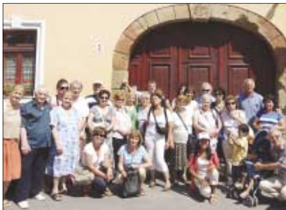
Óbudai görögök egy szentendrei ház kapuja előtt, melynek zárókövén a görög kereskedőjelvény látható

kedő fontosságú, hogy a görögországi Szerviában született görög Dionüsziosz Papajannuszisz (1750-1828) az Áthosz-hegyi Vatopediu-monostorban volt szerzetes, majd budai ortodox püspök lett. Püspökségének ideje alatt számos magyarországi görög