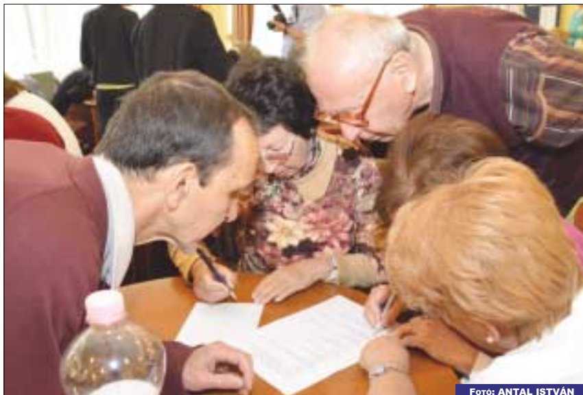
Műveltségi vetélkedő nyugdíjasoknak: idén a 100 esztendeje született Weöres Sándor élete és munkássága volt a téma

Az önként vállalt feladatok keretében zajló programok megszervezéséhez az önkormányzat saját intézményei, az itt működő civil szervezetek és az idősek aktív összefogására is szükség van. Többek között igénybe vehető számukra az idősek kedvezményes üdültetése, védett lakhatást biztosító nyugdíjsházak, a NagyNet program, a Zsigmond Károly Főiskolával kö-