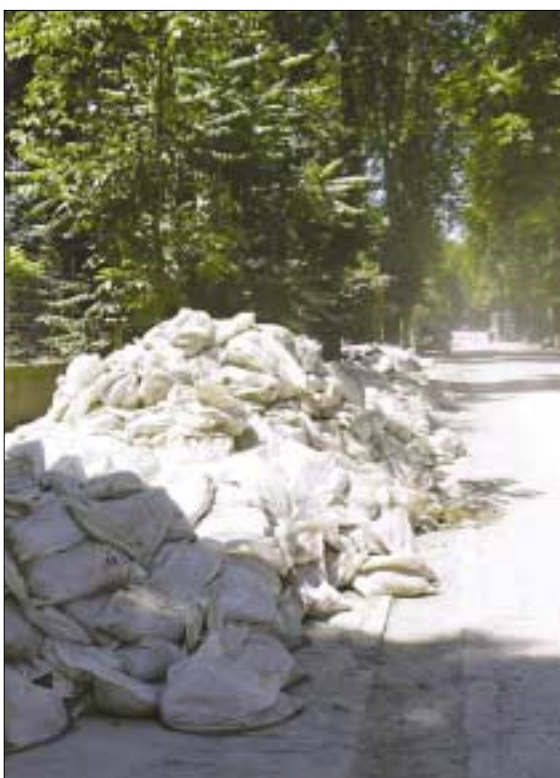
Elszállításra váró homokzsákok