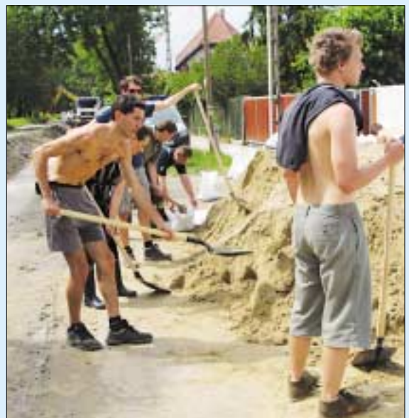
Naponta 600-an dolgoztak a védműveken

Az árvízi összeállítást készítette: Szeberényi Csilla, Klug Miklós