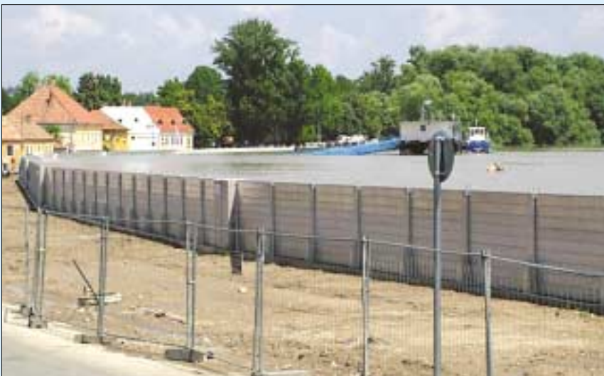
Kitűnőre vizsgázt a szentendrei mobil árvízvédelmi fal

A szentendrei és a külföldi tapasztalatokat figyelembe véve bizonyos, hogy meg kell építeni a mobil árvízi védművet a Római-parton - mondta Tarlós István főpolgármester június 11-én.