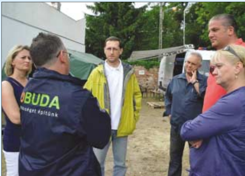
Varga Mihály nemzetgazdasági miniszter és óbudai képviselők helyszíni szemlén a Római-parton

és a későbbiekben is várhatóak fakidőlések. Ezért biztonsági okokból a szakemberek mindaddig zárva tartják a sziget kapuit , amíg a talajszerkezet nem válik stabilá, vissza nem nyeri egyensúlyát. A károk felmérése mindenütt folyamatban van.