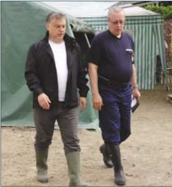
Orbán Viktor miniszterelnök és Bakondi György katasztrófavédelmi főigazgató a római-parti szemlén

Az I. fokú árvízvédelmi készültség elrendelését követően, mintegy 3,2 kilométeres partszakaszon, a Pók utcától a Pünkösdfürdő utcáig, illetve az Aranyhegyi pataknál és a Rozmaring vendéglátó magasságában megkezdődött a III. kerületi árvízvédelmi munka. 750 centiméteres vízállás elérését követően világossá vált,