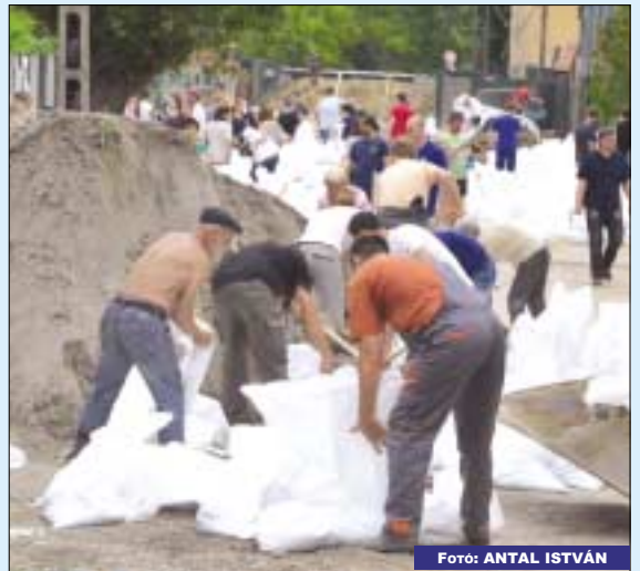
Az önkormányzat több mint 300 ezer homokzsákot biztosított az árvíz elleni védekezéshez

Az árvízi védekezésben segítséget nyújtó minden hivatásos és önkéntes résztvevőnek Óbuda-Békásmegyer Önkormányzata köszönetét fejezi ki.