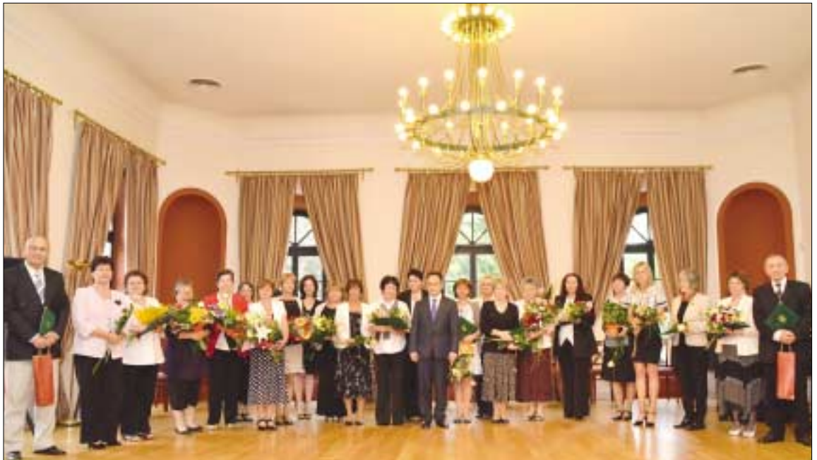
Közös felvételen a kitüntetettek és a díjakat átadók