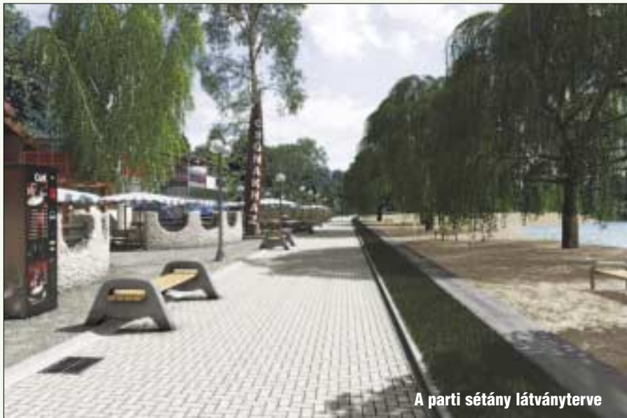
A parti sétány látványterve

Szükséges megjegyezni azt is, hogy - a kerület lakóövezeteiben élő állampolgároktól eltérően - az üdülőingatlanok tulajdonosai az üdülőövezetre vonatkozó adózási szabályok szerint teljesítik adófizetési kötele-