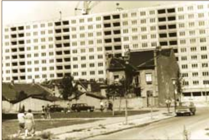
Panelépítkezés a Vörösvári úton, 1972

dó, ütött-kopott, ősoleg anyóka árulta a maga gyűjtötte, kókadó aranyvesszőfű-csokrokat. Akkoriban még nemigen szembesülhettünk a szegénységgel, hajléktalanok sem voltak - vagy csak a kitűnően szervezett rendszer fedte el létezésüket, bár nem hi-