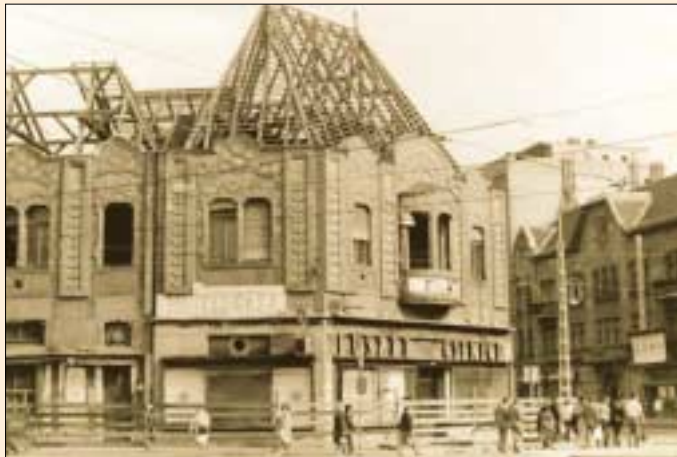
Szánálás Óbudán, Flórián tér, 1970-es évek eleje