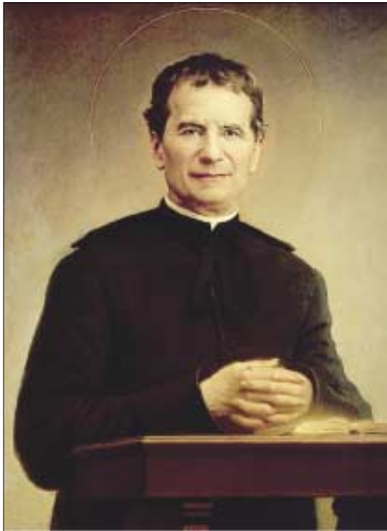
Bosco Szent János (Castelnuovo d'Asti, 1815. augusztus 16. - Torinó, 1888. január 31.), eredeti teljes nevén Giovanni Melchiorre Bosco Ochienna olasz katolikus pap, a Szalézi Társaság, férfi szerzetesrend megalapítója. Gyakran csak Don Boscoként emlegetik