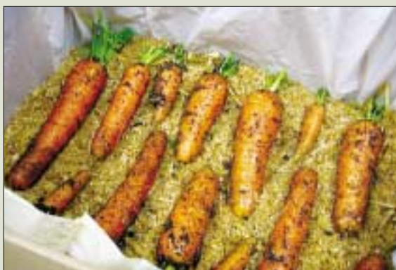
Összeállította: Domi Zsuzsa