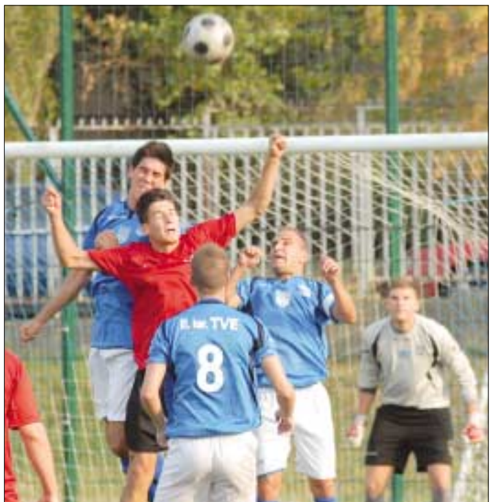
A Kerület csapata a műfüves pályán nem tudta mindig kihasználni a hazai pálya előnyét