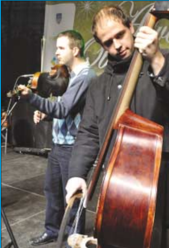
A Tulipánt Népzenei Együttes december 3-án lépett fel

Képriportunkban az advent második hétvégéjén a Fő téren történeteket foglaljuk össze.