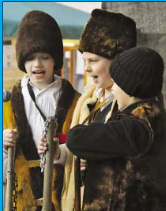
A Kicsi Rigók Gyermekkórus karácsonyi dalokkal lepte meg a közönséget