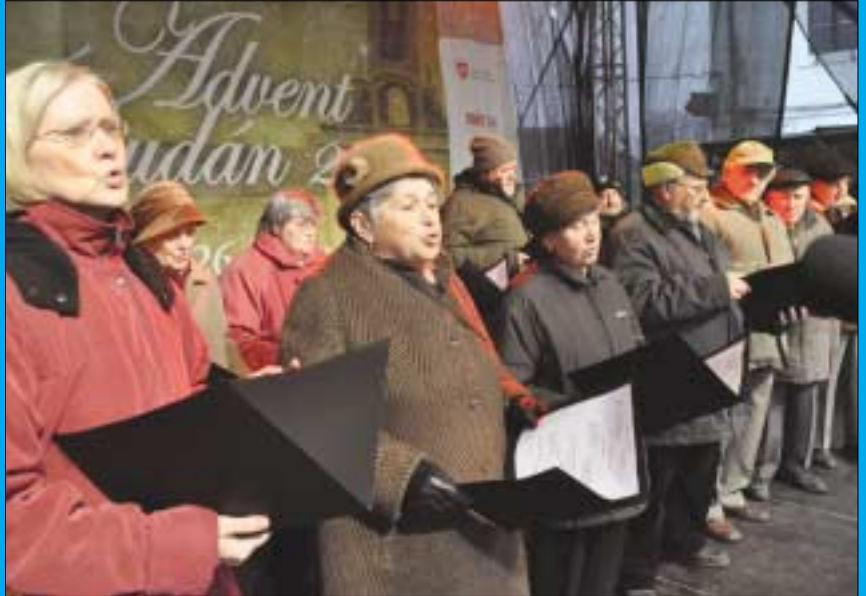
Az Óbudai Szociális Szolgáltató Intézmény ünnepi műsora