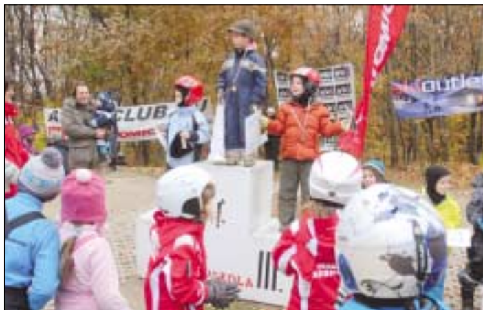
Öröm, boldogság, büszkeség a dobogón állni