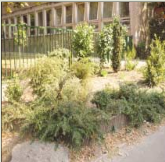
Örökbefogadás előtt és utána

Nemcsak az iskola közvetlen környéke lett szebb, de az arra közlekedők is megállnak és gyönyörködnek a felújított, „örökbe fogadott” zöldterületeken.