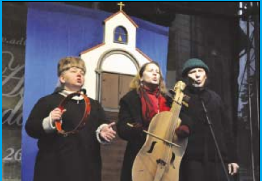
A Térszínház karácsonyi előadása