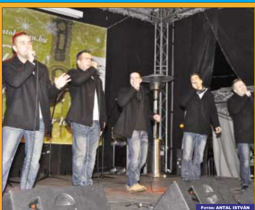
A Vivat Bacchus tagjai koncertjük után gyújtották meg az adventi gyertyát