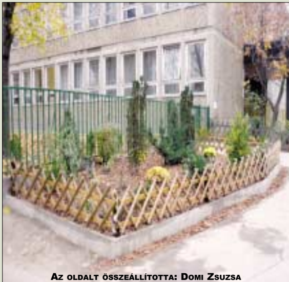
AZ OLDALT ÖSSZEÁLLÍTOTTA: DOMI ZSUZSA